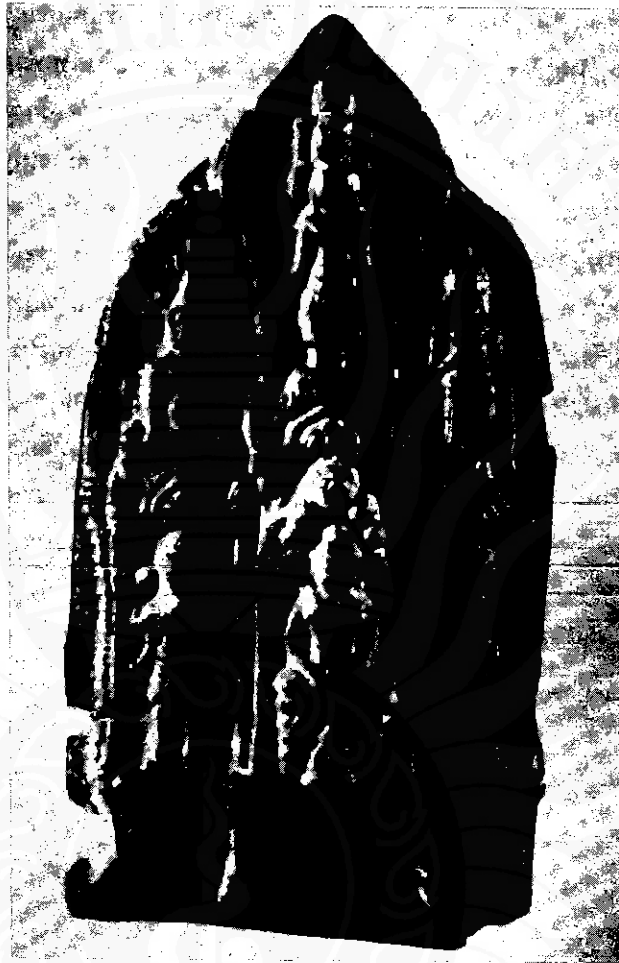
พระพิมพ์ดินเผากรุวัดนางตรา (ผาลโณนางตรา) อำเภอกำแพงแสน แสดงภาพพระพุทธรูปเจ้าหนาคปรกเจ็ดเศียร ประทับสมาธิภายในวิมาน เหนือพระพุทธรูปเจ้าหนาคปรก เป็นภาพนางปรัชญาปารมิตา (๑๑ เศียร ๒๒ กร) อายุประมาณครึ่งแรกของพุทธศตวรรษที่ ๑๘ (ภาพจากสารานุกรมวัฒนธรรมภาคใต้ เล่ม ๖)

พระพิมพ์ที่พุทธศาสนิกชนปัจจุบันถือเป็นรูปเคารพอย่างหนึ่งในพุทธศาสนานั้น มีกำเนิดมาจากประเทศอินเดียในสมัยราชวงศ์กุษาณะ ราวพุทธศตวรรษที่ ๖-๑๐ กษัตริย์องค์สำคัญที่สุดของราชวงศ์นี้คือ พระเจ้ากนิษกะ (พ.ศ. ๖๒๑-๖๘๗) ทรงยกย่องอุปถัมภ์พระพุทธรูป และส่งเสริมการทำพระพิมพ์และรูปปั้นดินเผาขนาดเล็กขึ้นอย่างกว้างขวาง มีพระพิมพ์ที่เกิดขึ้นมีอยู่สองสกุลช่าง คือ สกุลช่างอินเดียภาคกลาง และสกุลช่างอินเดียภาคตะวันออกเฉียงเหนือ มีมือสกุลช่างภาคกลาง ได้แก่ วัดถุนดินเผา และพระพุทธรูปจากตักศิลา และโซเลียน