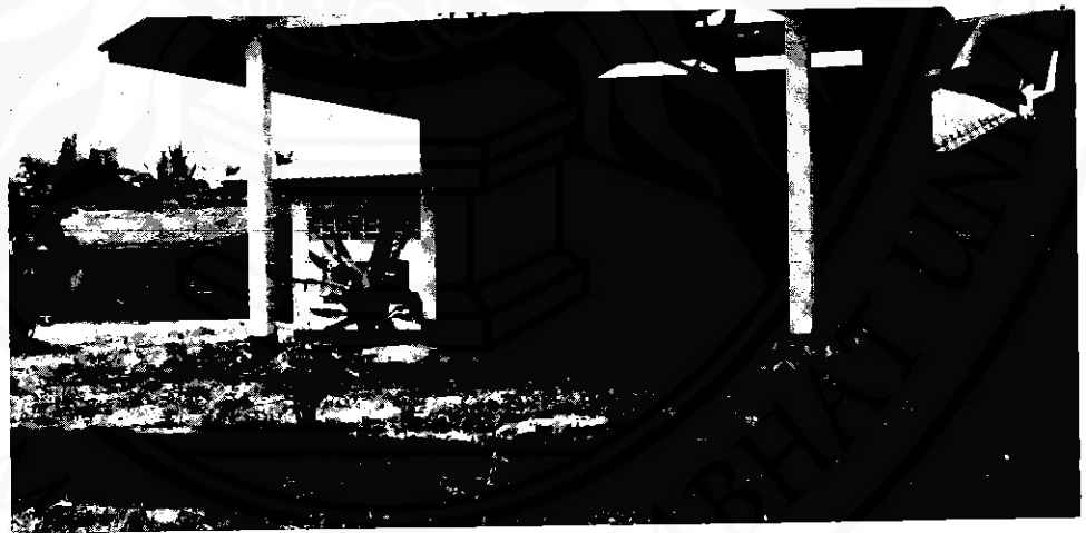
วัดนางตราง (วัดพนักตราง) ตำบลไทยบุรี อำเภอกำทาสาลา จังหวัดนครศรีธรรมราช

เมื่อ พ.ศ. ๒๕๐๐ กรมศิลปากรได้เข้าดำเนินการขุดค้น หลักฐานทางโบราณคดีที่หลงเหลืออยู่ก่อนขุดค้น ได้แก่ พระอุโบสถ เจดีย์ พระพุทธรูปประธาน เศียรนพ