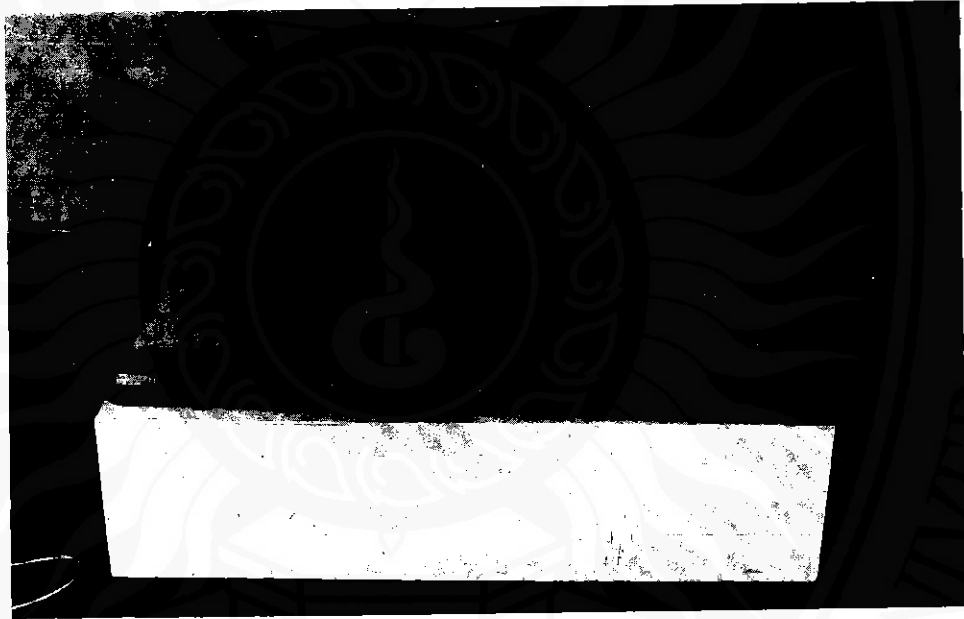
ภาพที่ ๑ ปริศนาบทหนึ่งว่า "สองหูชูตา สองขาชูรัง เอ็นอยู่ข้างหลัง รังอยู่หว่างขา" (เฉลยว่า ไนและที่หมุนด้าย)

เขาสองเขา เรือสำเภาล่นกลาง ชานางชยับ นู้ก้าเขา นี้ก้าเขา เรือสำเภา ล่นมา นางทั้งห้า นั่งถ้ำรับเรือ สาวน้อยร้อยชั่ว มานั่งชักใบ เสาสำเภาใหญ่ แกว่งไปแกว่งมา ๒