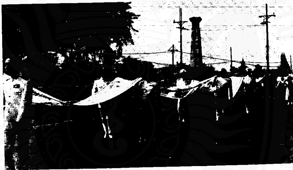
ภาพที่ ๒ ผ้าพระบฏพระราชทานจากสมเด็จพระเทพรัตนราชสุดาฯ สยามบรมราชกุมารี ที่ชาวนครศรีธรรมราชไปท่อมองค์พระบรมธาตุเจดีย์ในวันมาฆบูชาของทุกปี นับตั้งแต่ พ.ศ.๒๕๓๐ เป็นต้นมา

ล่วงมาในยุคที่พุทธศาสนิกชนเริ่มรู้จักและนิยมทำพระพิมพ์พระเครื่องด้วยดินดิบบ้างดินเผาบ้าง และโลหะสำริดบ้าง ความนิยมทำผ้าพระบฏก็ค่อยลดลง เพราะพระพิมพ์พระเครื่องเป็นรูปเคารพแทนองค์พระ