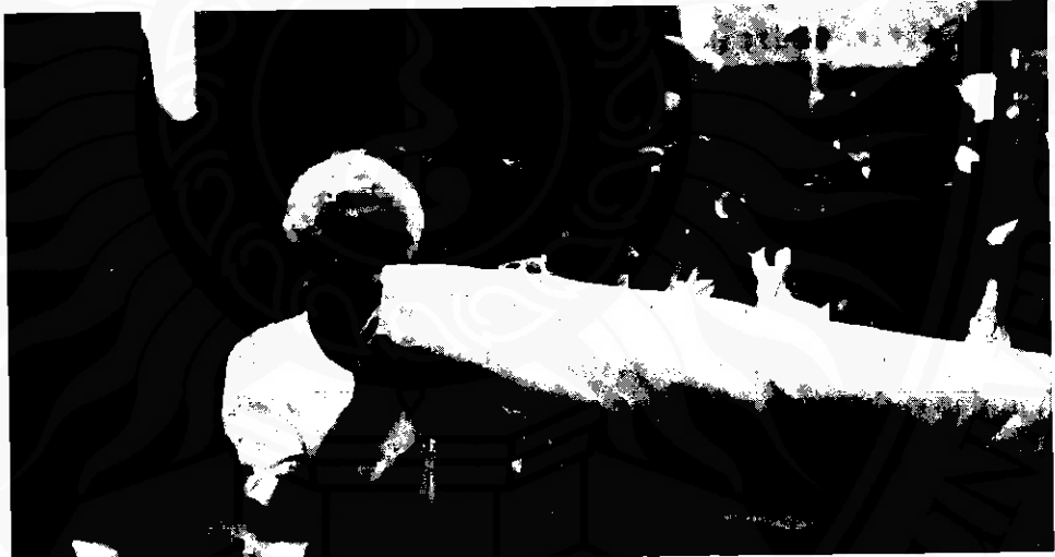
ผ้าสีเหลืองและผ้าสีแดงที่พุทธศาสนิกชนชาวนครแห่งแห่มาเพื่อบูชาพระสัมมาสัมพุทธเจ้า ในวันแห่ผ้าขึ้นธาตุ

ส่วนผ้าพระบฏในนครศรีธรรมราชทุกวันนี้เปลี่ยน แปลงรายละเอียดไปจากเดิมมาก แต่เดิมเมื่อจะทำ ผ้าพระบฏต้องใช้ช่างผู้ชำนาญเขียนภาพสีเกี่ยวกับพุทธ ประวัติ แล้วใช้ช่างฝีมือทอผ้ามาประดับด้วยลูกปัดสี ต่างๆ ที่มีศรัทธาแก่กล้าก็นิยมใช้ สตรีที่มีฝีมือเย็บปัก ถักร้อยมาเย็บผ้าแพรพรรณและดอกไม้ที่ขอบแถวผ้า โดยตลอดทั้งผืน ปัจจุบันสภาพสังคมสืบสน หาเวลาว่าง ไม่ค่อยได้ และขาดช่างผู้ชำนาญ จึงทำให้การเขียน และประดับประดาผ้าพระบฏสูญหายไป เมื่อถึงงาน ประเพณีแห่ผ้าขึ้นธาตุแต่ละปีจะหาผ้าพระบฏเข้าร่วม ขบวนแห่ได้ยากเต็มที ผ้าที่ใช้กันทุกวันนี้เห็นเพียงสามสี คือ ขาว แดง และเหลือง ภัตตาหารเครื่องอุปโภค และบริโภคที่เคยจัดไปถวายพระในวันแห่ผ้าขึ้นธาตุก็ ตัดออกไป ซึ่งนับเป็นเรื่องที่น่าเสียดายยิ่ง