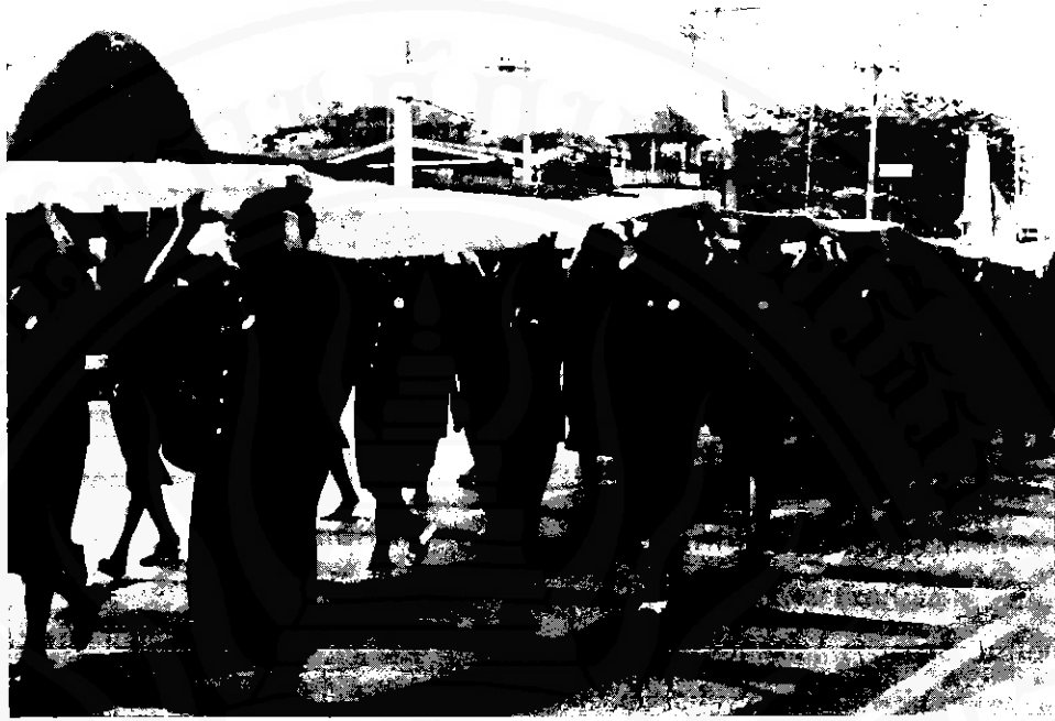
ภาพที่ ๓ ทบวนแห่ผ้าขึ้นธาตุ

ซึ่งชาวนครพร้อมใจกันจัดไปบูชาพระบรมธาตุเจดีย์ทุกปีในวันเพ็ญเดือนสาม (วันมาฆบูชา)