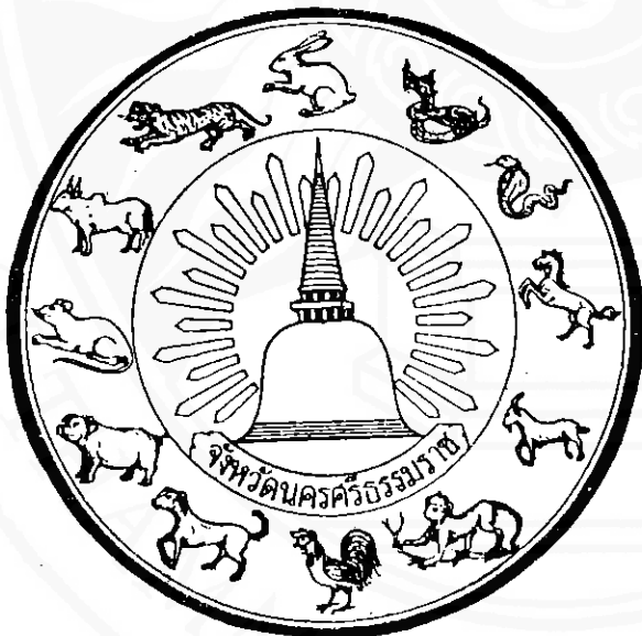
ตราสิบสองนักษัตร สัญลักษณ์แห่งศูนย์กลางความเจริญรุ่งเรืองทางศิลปวัฒนธรรมในดินแดนแหลมทองของเมืองนครศรีธรรมราช