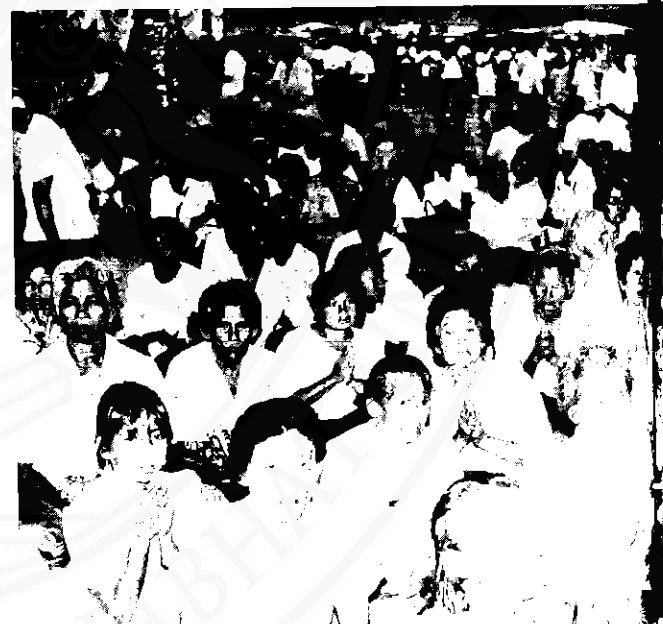
สัมพันธ์ภาพระหว่างชาวชนบทกับชาวเมืองเกิดจากความศรัทธาในองค์พระบรมธาตุเจดีย์

ตามปกติปฏิสัมพันธ์ระหว่างชาวชนบทกับตัวเมืองโดยทั่วไป มักเกิดขึ้นในกิจกรรมในทางการติดต่อราชการ และกิจกรรมเชิงเศรษฐกิจ แต่ในกรณีของนครศรีธรรมราช องค์พระบรมธาตุเจดีย์ได้เพิ่มบทบาทในฐานะเป็นศูนย์กลางกิจกรรมทาง