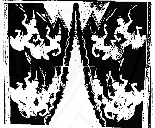
วรรณกรรมลายลักษณ์เรื่อง "พระนิพพานโสตร"