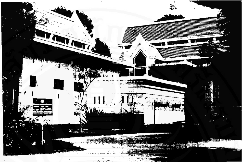
พิพิธภัณฑ์สถานแห่งชาตินครศรีธรรมราช

๓.๒.๔ องค์พระบรมธาตุเจดีย์เป็นศูนย์รวมแห่งศรัทธาของปวงชนจึงปรากฏว่ามีผู้นำสิ่งของต่าง ๆ มาสักการะเป็นจำนวนมาก ปัจจุบันนี้ทางวัดด้วยความร่วมมือของพิพิธภัณฑ์สถานแห่งชาติ นครศรีธรรมราช ได้สำรวจจัดทำบัญชีสิ่งของที่มีผู้นำมาสักการะ ซึ่งทางวัดเก็บไว้ในวิหารไพริลลังกาและวิหารเขียน พบว่ามีสิ่งของทั้งหมดจำนวน ๔๐,๑๖๒ ชิ้น เนื่องจากการจัดทำทะเบียนยังไม่แล้วเสร็จ จึงยังไม่ศึกษาหาข้อมูลได้โดยละเอียด เท่าที่ประเมินได้เป็นเบื้องต้น พอจำแนกประเภทสิ่งของได้ดังนี้