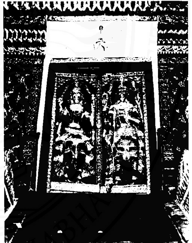
วิหารพระนิพนชกรบรมธาตุ ยี่สิบสามชั้นขึ้นทางขึ้นลง

ส่วนในภาคกลาง นอกจากเจดีย์หลายองค์ในพระนครศรีอยุธยา จะได้รับอิทธิพลจากพระบรมธาตุเจดีย์นครศรีธรรมราชแล้ว เจดีย์อีกหลายองค์ในกำแพงเพชรและสุโขทัยก็ได้รับอิทธิพลจากพระบรมธาตุเจดีย์องค์นี้ด้วย เช่น เจดีย์ที่วัดศรีพิจิตรกรกิตถ์ถาราม อำเภอเมือง จังหวัดสุโขทัย, เจดีย์ที่วัดช้างรอบ อำเภอเมือง จังหวัดกำแพงเพชร, เจดีย์ที่วัดช้างล้อม อำเภอศรีสัชนาลัย จังหวัดสุโขทัย และเจดีย์ช้างล้อม วัดสรศักดิ์ อำเภอเมือง จังหวัดสุโขทัย เป็นต้น ในทำนองเดียวกันเจดีย์หลายองค์ในภาคเหนือก็ได้รับอิทธิพลจากพระบรมธาตุเจดีย์องค์นี้ เช่น เจดีย์ที่วัดสวนดอก อำเภอเมือง จังหวัดเชียงใหม่, เจดีย์ที่วัดอุโมงค์อารยมณฑล อำเภอเมือง จังหวัดเชียงใหม่, และเจดีย์วัดป่าแดงหลวง อำเภอเมือง จังหวัดเชียงใหม่ เป็นต้น "