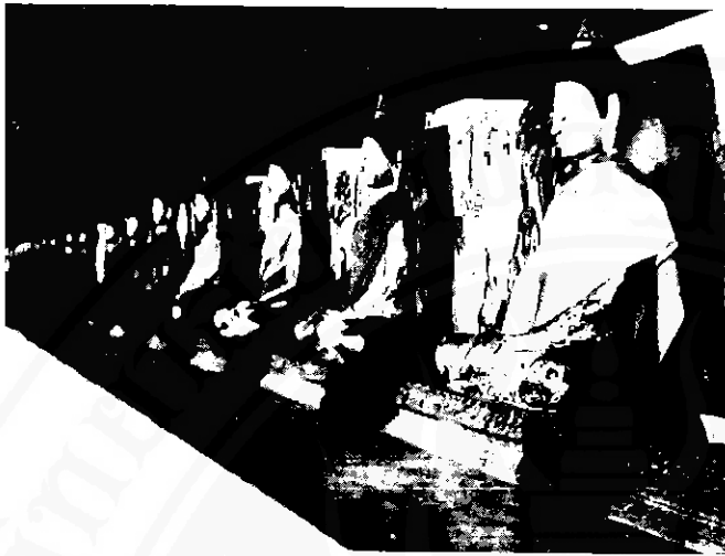
พระพิงเสาดั่ง หลังคามงเบ็อง

ไปคอนห่อ พระพิงเสาดั่ง เข้าไปในห้อง หลังคามงเบ็อง