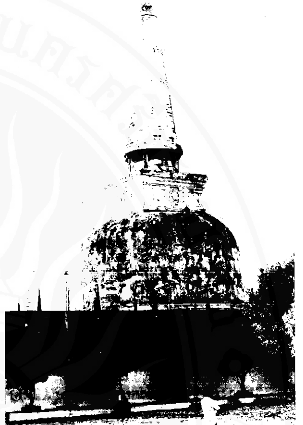
องค์พระบรมธาตุเจดีย์นครศรีธรรมราชที่พระเจ้าศรีธรรมโศกราชทรงสร้างขึ้น ณ บริเวณหาดทรายแก้ว