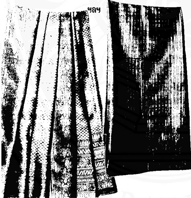
ผ้ายกเมืองนคร สื่อแสดงความเจริญรุ่งเรืองด้านศิลปหัตถกรรม