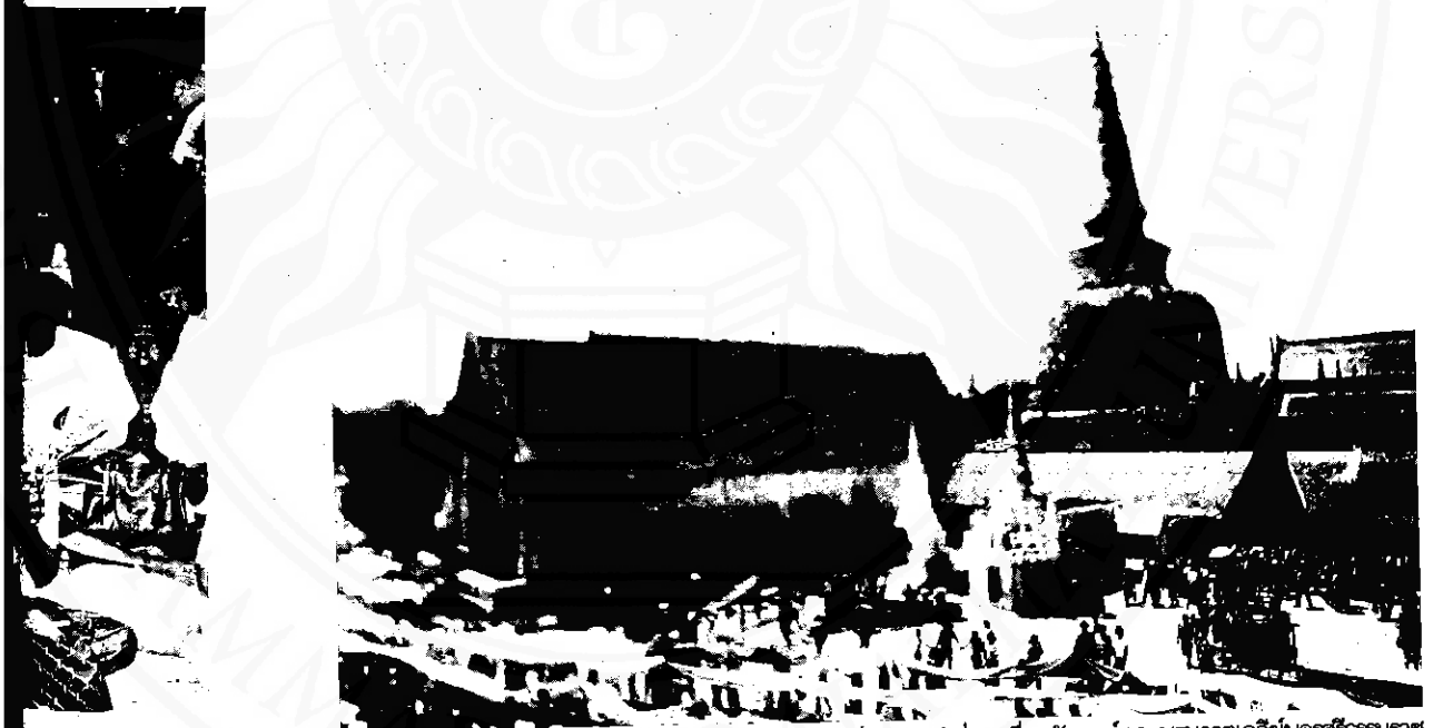
ประเพณีแห่ผ้าขึ้นธาตุหนึ่งเป็นประเพณีที่สัมพันธ์เกี่ยวเนื่องกับองค์พระบรมธาตุเจดีย์นครศรีธรรมราช

จาริตประเพณี และกติกากของสังคมอันเกี่ยวข้องกับคุณสมบัติประการหนึ่งของสตรีที่สังคมภาคใต้ยึดถืออย่างมั่นคงสืบต่อมาหลายชั่วอายุคนคือ