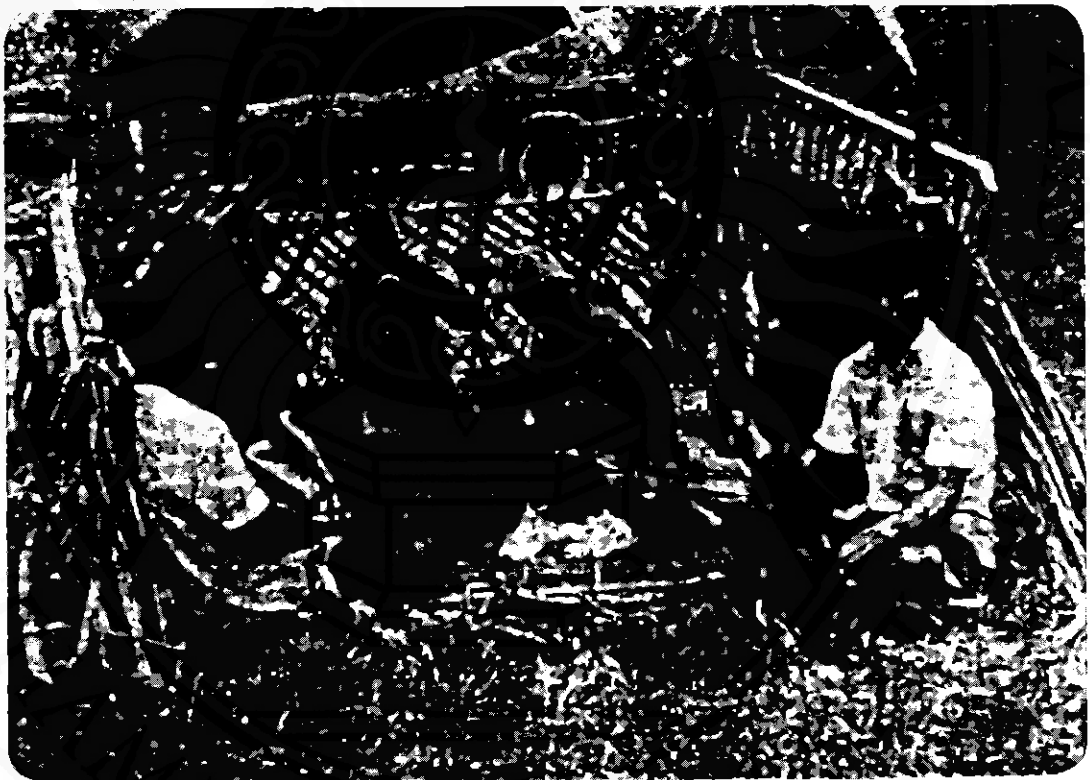
ลักษณะของโรงซึ่งปลูกเพื่อบรรเลงกาด