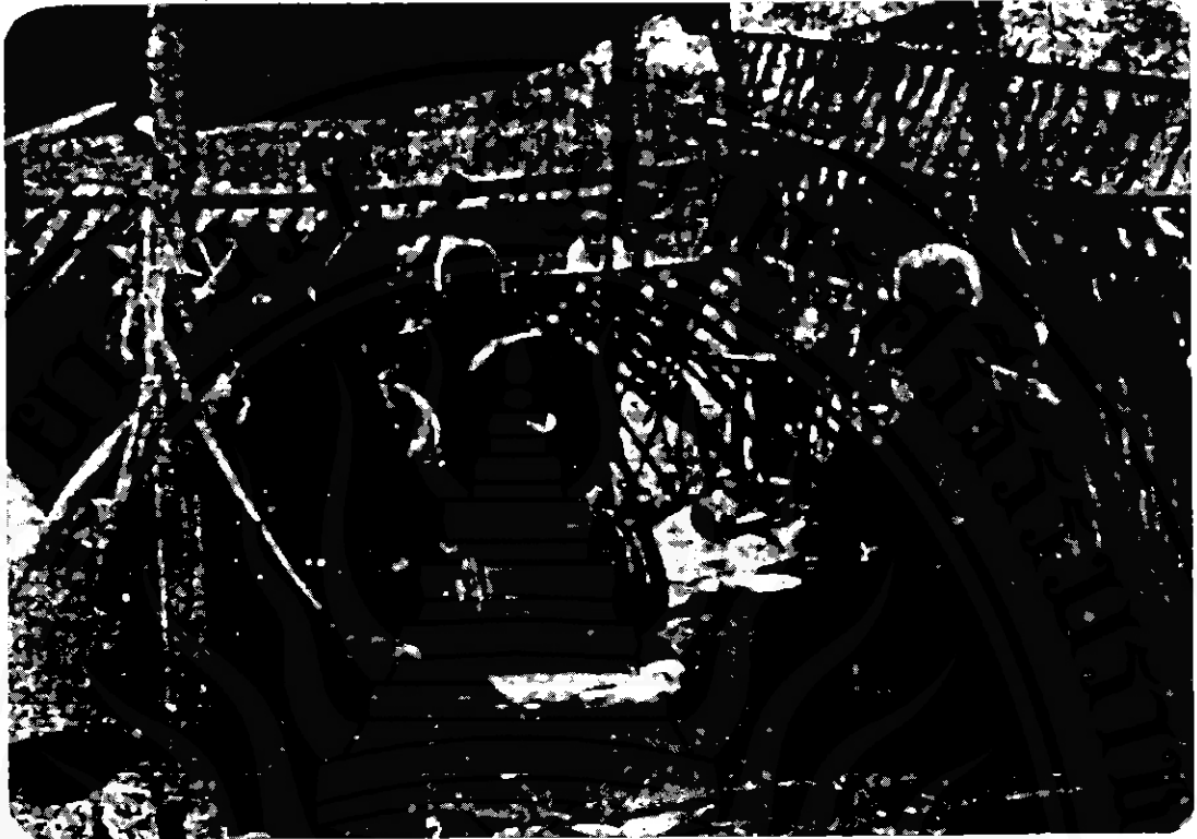
วงกาดที่มีชื่อเสียงแห่งอำเภอทุ่งสง จังหวัดนครศรีธรรมราช