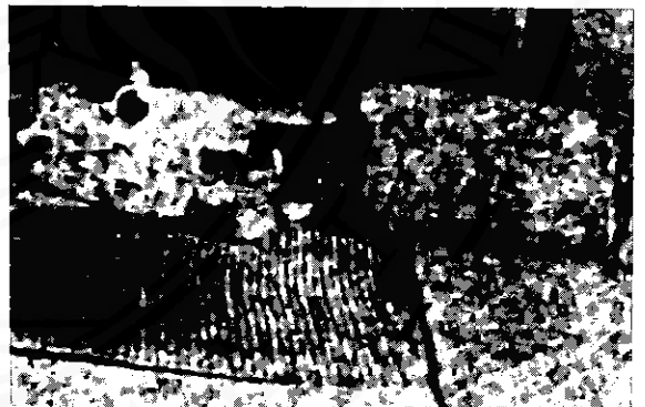
เครื่องบูชากาหลอและเครื่องดนตรี

ถ้าเป็นในงานศพ หากรับงานในวันเผาศพ พิธีการและธรรมเนียมต่างๆ จะมีน้อย คือ เพียงไปบรรเลงหน้าศพจากบ้านไปเผาที่วัด ไม่จำเป็นต้องปลุกโรงพิธี แต่ถ้าหากกาหลอรับงานก่อนวันเผา คือ ต้องไป