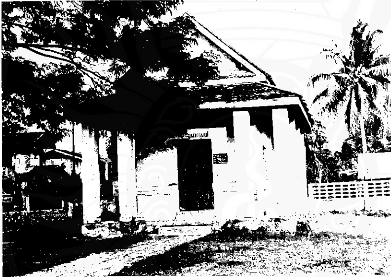
หอพระนารายณ์ อำเภอมือง จังหวัดนครศรีธรรมราช โบราณสถานเนื่องในศาสนาพราหมณ์

๔.๔ ใช้尼ทานมาปรุงแต่ง เป็นหนังสือสำหรับนักเรียนระดับ ต่างๆ โดยอาศัยเทคนิควิธีให้ สอดคล้องกับยุคสมัยทั้งระบบการ พิมพ์และการจัดภาพประกอบ