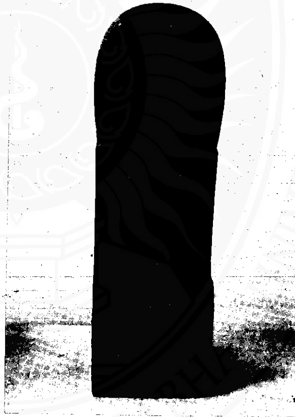
ศิลาลึงค์ โบราณวัตถุ เืองในศาสนาพราหมณ์เป็นองค์แทนพระอิศวร พบในเขตอำเภอสิชล ท่าศาลา เมือง นครศรีธรรมราช

เมื่อพระผู้เป็นเจ้าทั้งสอง ทรงตกลงกันแล้วพระอิศวรจึงได้ ทรงขึ้นไปยืนด้วยพระบาทเพียงข้าง เดียวบนหลังพญานาคราช ใน ลักษณะทำไขว่ห้างดังกล่าวแล้ว พญานาคราชก็ไกวตัวขึ้นๆ ... และแรงขึ้นๆ ตามลำดับ แต่พระผู้ เป็นเจ้าก็ไม่ได้หวั่นไหวยังทรงยืน ประทับอยู่ในท่าเดิมเช่นนั้นไป โดยตลอด