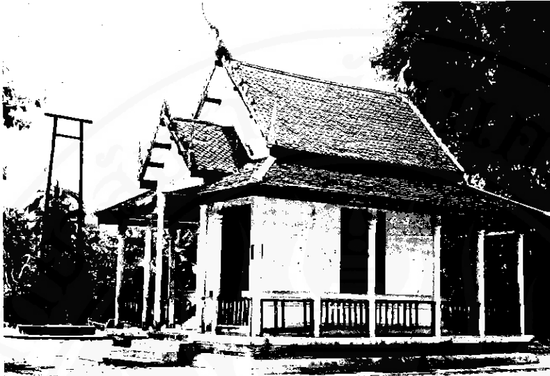
หอพระอิศวรและเสาชิงช้า อำเภอมือง จังหวัดนครศรีธรรมราช โบราณสถานเนื่องในศาสนาพราหมณ์