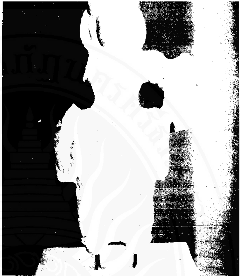
พระนารายณ์ โบราณวัตถุเนื่องในศาสนาพราหมณ์ พบในอำเภอกาชาลา สิบล เมือง นครศรีธรรมราช