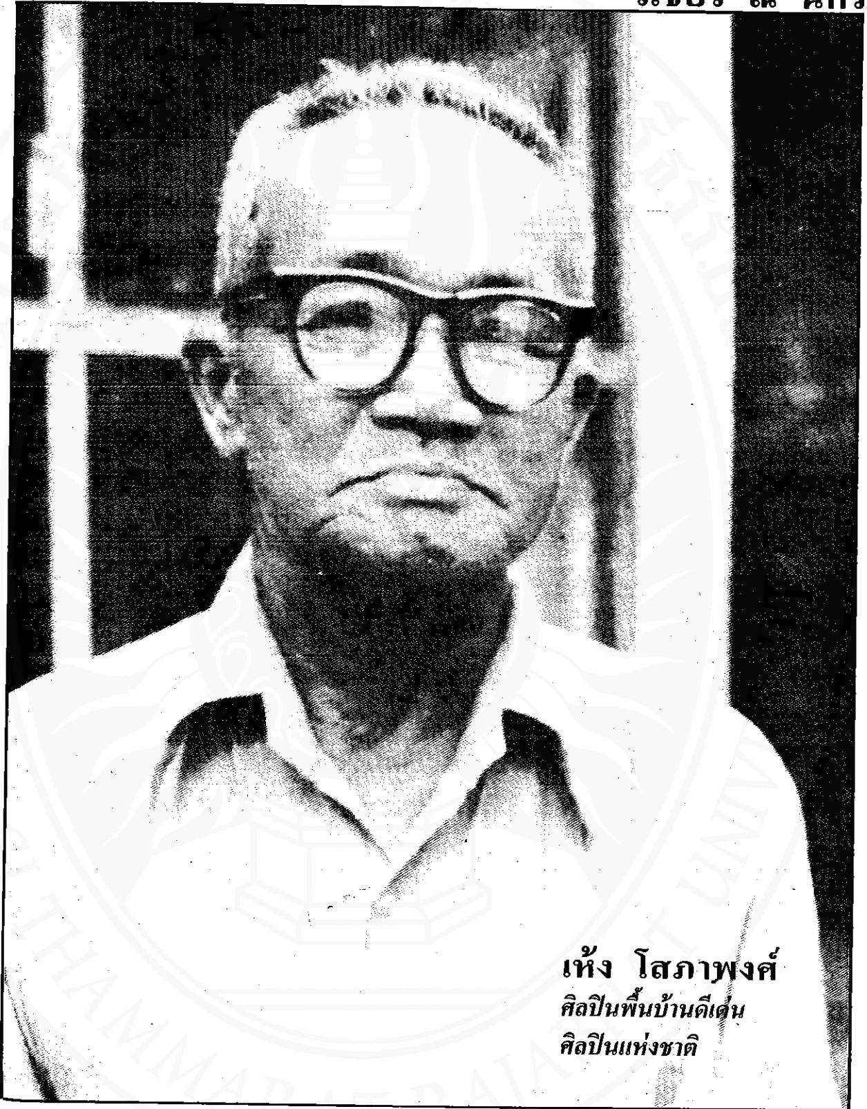
เห็ง โสภาพงศ์ ศิลปินพื้นบ้านดีเด่น ศิลปินแห่งชาติ