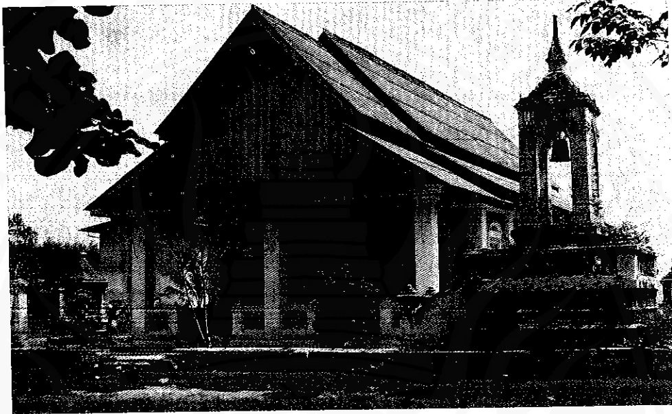
โบสถ์และหอรระฆังวัดโดนธาราม