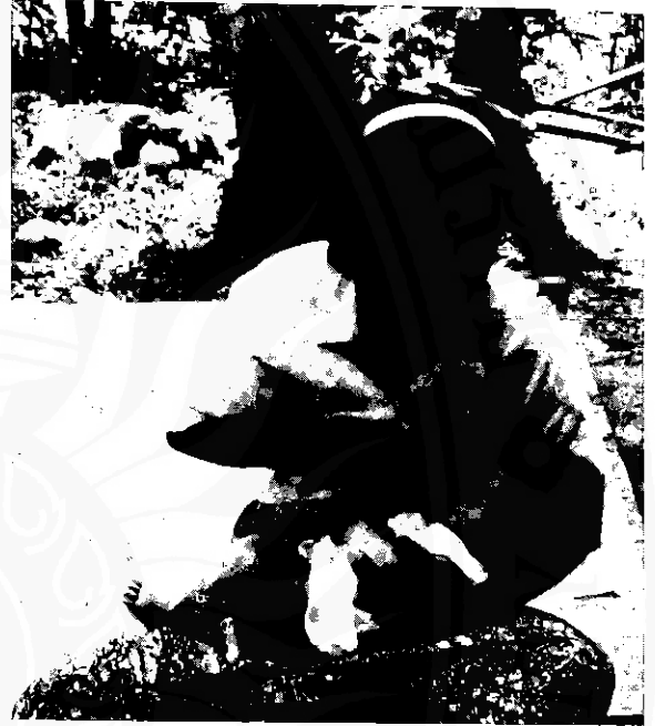
เด็กดูนม

ก้อนเนื้อ แยงรูเนื้อ พอรอยเหลือ น้ำขาวออก (ลูกดูนมแม่) นอนแคง แยงรู รอยจ้งหู น้ำขาวออก (แม่อนนให้ลูกดูนม) หัวเนื้อ แยงรูเนื้อ น้ำออกเพรือ ต็อกตีใจ (เด็กดูนมแม่) เนื้อแนบเนื้อ อร้อยเหลือเมื่อน้ำไหล (เด็กดูนมแม่)