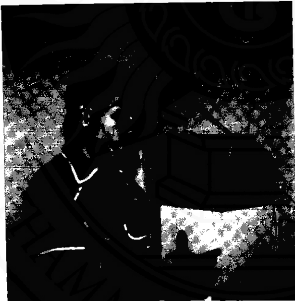
โทรทัศน์