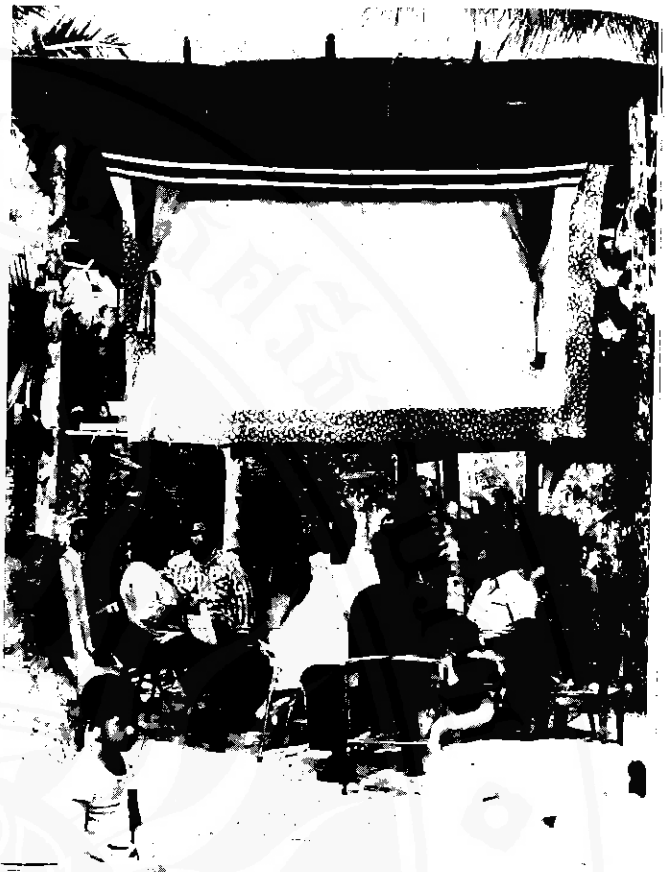
นายหนังตะลุงชักขัมลูกคู่ก่อนขึ้นทำการแสดง

มมมทลสพพื้นบ้าน ซึ่งเป็นที่นิยมอย่างแพร่หลายและปรากฏในปรีศนาเมืองนครศรีธรรมราช ได้แก่