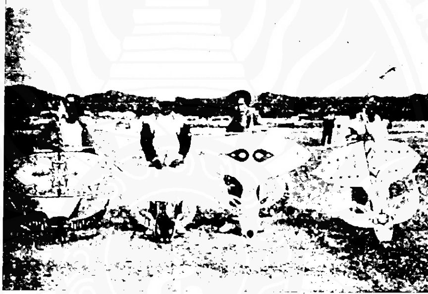
การแข่งขันว่าว