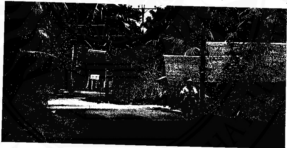
ถนนภายในหมู่บ้านศาลาบางปู (หมู่ที่ ๑๐ ตำบลปากพูน)

เมื่อราชการจัดแบ่งเขตปกครองพื้นที่ตำบลปากพูน จึงนำเอาชื่อ "ศาลาบางปู" มาเป็นชื่อหมู่บ้าน และใช้สืบมาตราบปัจจุบัน