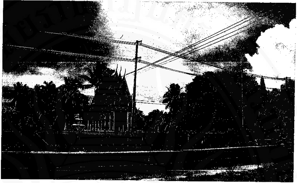
วัดวิสุทธิาราม (วัดบางปู) เป็นวัดหลักของบ้านศาลาบางปู