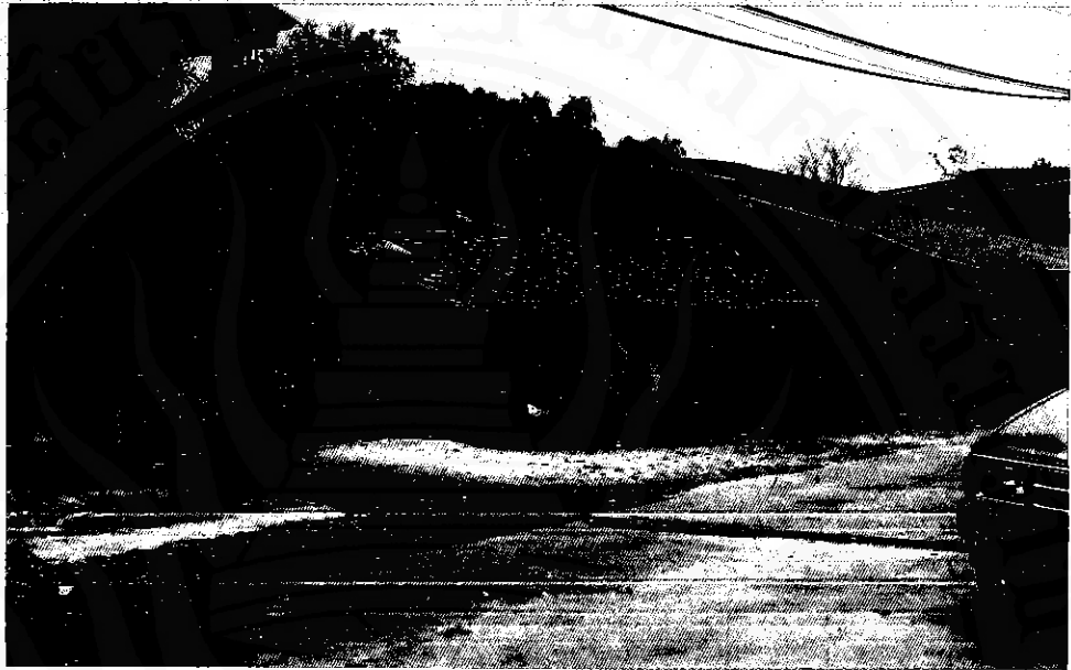
บ้านสวนจันทน์ในปัจจุบัน ไม่มีร่องรอยความเป็นสวนไว้อีกเลย (มิถุนายน ๒๕๕๑)