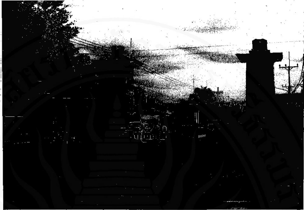
ค้ายวปิววุด อันเป็นที่ตั้งกองบัญชาการกองทัพนาคที่ ๔ ตั้งอยู่ในพื้นที่บ้านสวนจันทร์ (หมู่ที่ ๕ ตำบลปากพูน)