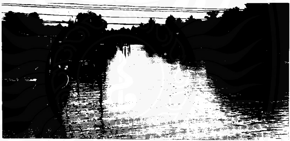
คลองขุด (หรือคลองนครพญา) ซึ่งเป็นลำน้ำที่เชื่อมระหว่างคลองปากนครกับคลองท่าซัก ขุดในสมัยรัชกาลที่ ๕ ครั้นพระยาสุโขมนัยวินิตเป็นข้าหลวงเทศาภิบาลมณฑลนครศรีธรรมราช

ท่าซัก (คลองท่าวัง) ได้สะดวกรวดเร็วขึ้น เพราะหาก ไม่มีคลองลัด ชาวบ้านในตำบลท่าซักกับตำบล ปากนครต้องใช้เวลาเป็นวัน จึงจะไปมาหาสู่กันได้ ทั้งๆ ที่ตำบลทั้งสองอยู่ไม่ไกลกัน จากเสียงเรียกร้อง ดังกล่าว พระยาสุโขมนัยวินิต (ปั้น สุขุม) ข้าหลวง เทศาภิบาลมณฑลนครศรีธรรมราช จึงได้ตัดสินใจ ขุดคลองลัดระหว่างคลองปากนครกับคลองท่าซัก เมื่อ