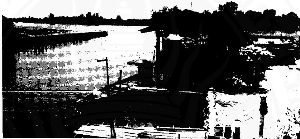
ปากคลองขุดซึ่งเชื่อมกับคลองปากนครหรือคลองหัวตรุด (ถ่ายเมื่อวันที่ ๒๔ เมษายน ๒๕๕๑)