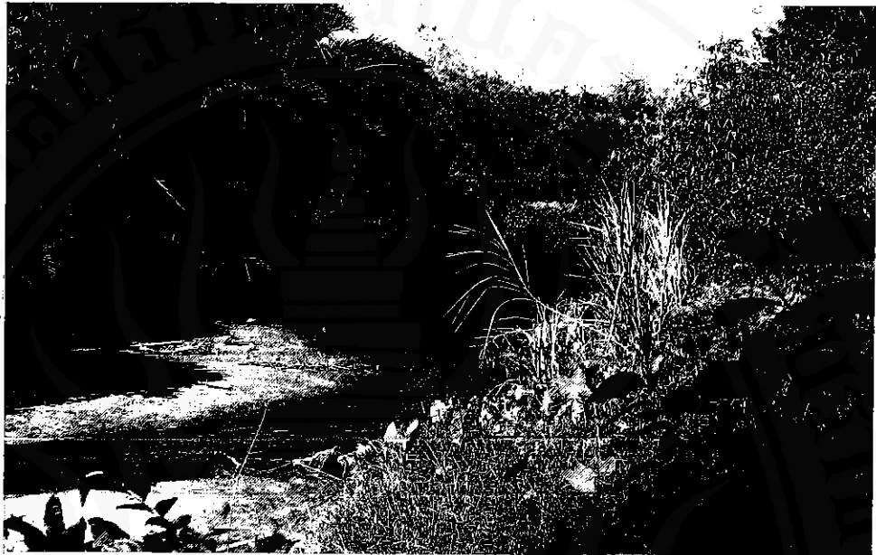
คลองขุนน้ำทำจัว (คลองบ้านตาล) ไหลจากตำบลทำจัว ผ่านหมู่บ้านยางเตี้ยด้วย กลายเป็นที่หมายแห่งหนึ่งซึ่งชาวต่างถิ่นรู้จัก (ถ่ายเมื่อมีนาคม ๒๕๔๑)