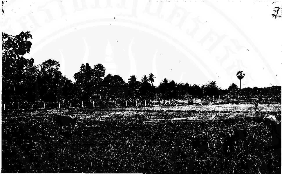
สภาพภูมิประเทศบ้านเหว็ด (หมู่ที่ ๔) ตำบลนาทราย อำเภอเมือง จังหวัดนครศรีธรรมราช โดยทั่วไปเป็นที่ราบ มีป่าโปร่งสลับกันอยู่ระหว่างทุ่งนา