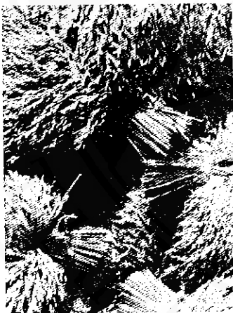
ผลผลิตของชาวนอก

ชาวนอก : คือกลุ่มชนที่อยู่แถบลุ่มแม่น้ำสายฝั่งทะเล ได้แก่ เขตพื้นที่บริเวณลุ่มแม่น้ำปากพนัง เป็นต้น