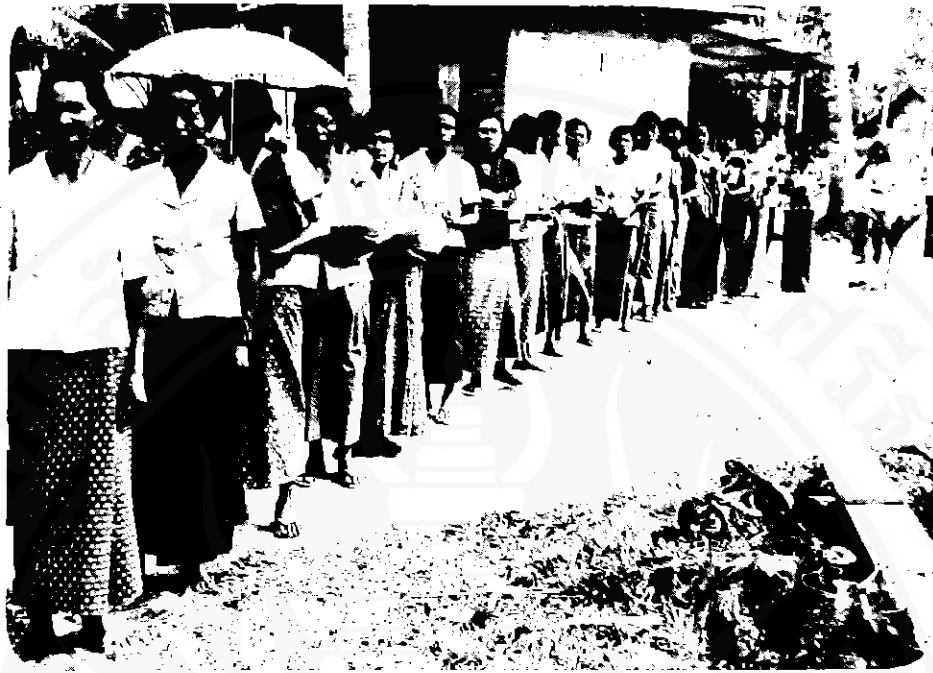
ชาวบ้านจำนวนมาก ถึงบ้านเจ้าสาวในวันแต่งงาน