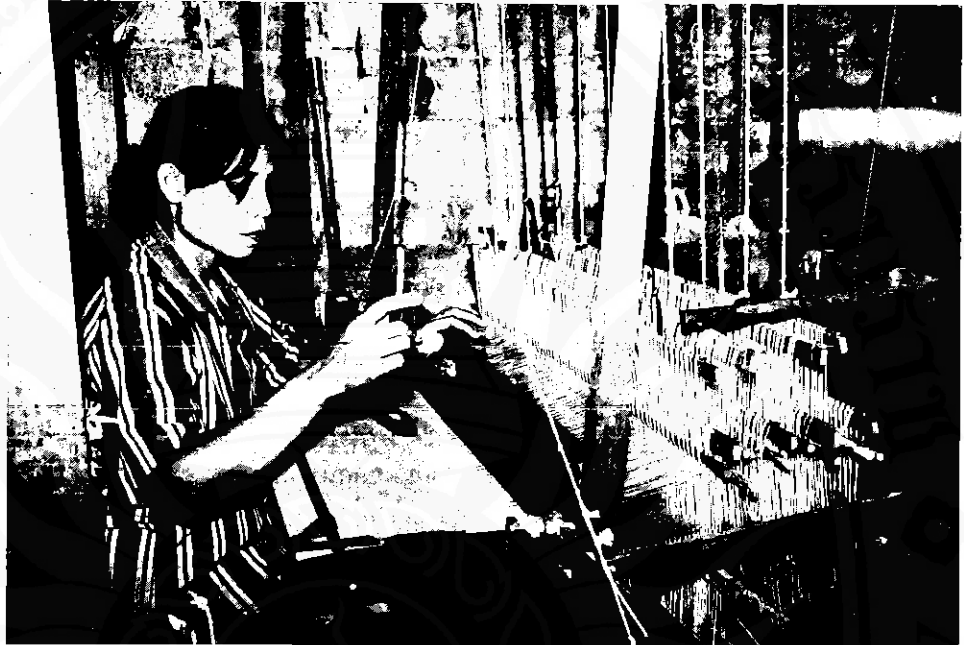
เกิดเป็นสตรีต้องชำนาญชำนาญใน "กิจการงานเรือน" อนุภาคหนึ่งจากนิทาน เรื่อง "นายตัน" ปัจจุบันยังเห็นเป็นดังนี้

"ฝ่ายเมียก็ทอหูกทอผ้า...นางจึงไร้อีกกลับบ้านเพื่อจัดเตรียมอาหารเอามาให้ผัวกินในตอนเที่ยงวัน... อยู่มาวันหนึ่งเมื่อนางจึงไร้อีกจัดสำหรับค้อนไวให้ผัวที่ในห้องแล้ว นางก็ลงมามีบ้ายที่ได้นุ่งบ้านตามเคย"