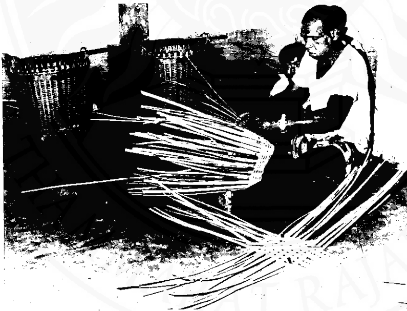
อนุภาคที่เด่นอนุภาคหนึ่ง ในนิทาน เรื่อง "นายดัน" ลูกผู้ชายที่มีฝีมือคือคนที่สังคมต้องการ เป็นพ่อบ้านพ่อเรือนที่ดีได้

"พูดละอ่อนนอนขอเมีย ค่าสินเบี่ยใครจะยินดี แต่กระบานสานไม่ถูก จะขอลูกเขาหรือหน่า เรือกสวนแร่นหัว ทั้งไร่นาไถไม่ป็น"