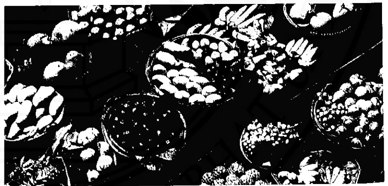
ผลผลิตของชาวเหนือ