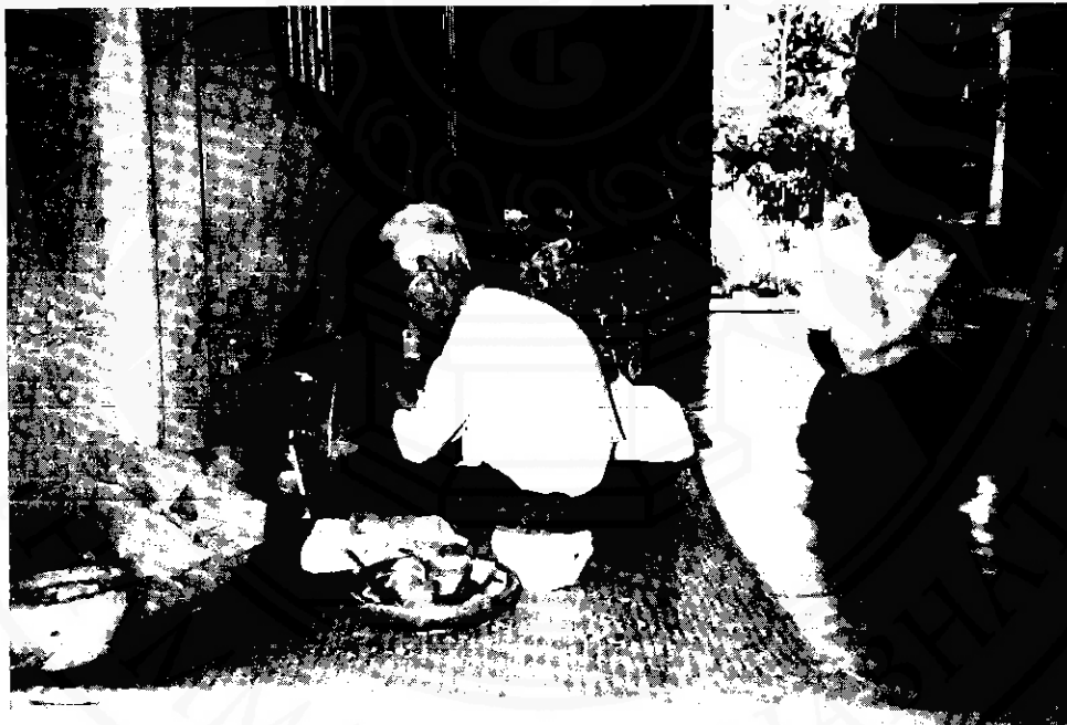
หมอบกราบ ก่อนทำการใดๆ ก็ไหว้ครูก่อน