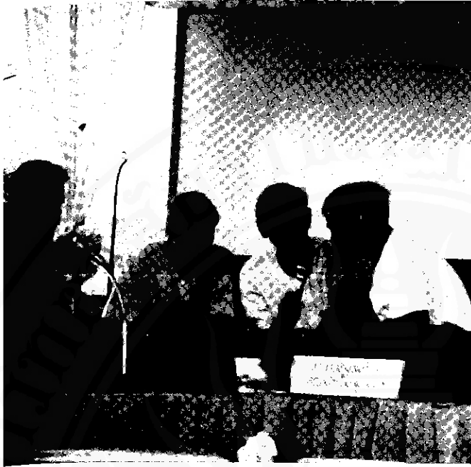
การประกวดแข่งขันเพลงบอก ก่อนทอดกัณฑ์ตามฤๅติ มีการไหว้ครูก่อน