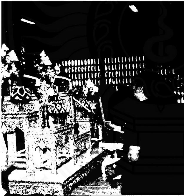
พิธีไหว้ครู ในสถานศึกษา