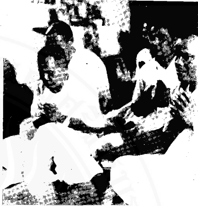
ศิลปินหนังตะลุง ขณะจัดพิธีไหว้ครู

นบวราทนาถไ้ สยามภู นบธรรมวิริศครู โลกไสร้ พระอัยฎาจารย์ดู นบเหนื่อ เกล้าหนา ขอแจกสารโศลกไ้ ตราบเท่ากัลปลา