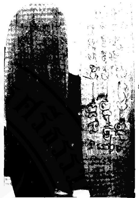
การลงอักขระลงในใบไม้พายเป็นวิธีการสร้างขวัญและกำลังใจแก่ฝีพายวิธีหนึ่ง