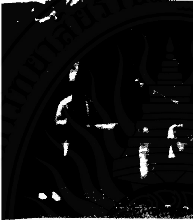
ชาวบ้านแห่พระไปตามถนนหนทาง

พระ ๗-๑๕ วัน เป็นการเตือนให้ชาวบ้านทราบว่าเป็นวันแรม ๑ ค่ำ เดือน ๑๑ จะมีการลากพระแน่นอน เพื่อจะได้ร่วมกันเตรียมการล่วงหน้า การประโดมจะมีทั้งกลางวันและกลางคืนติดต่อกันไป