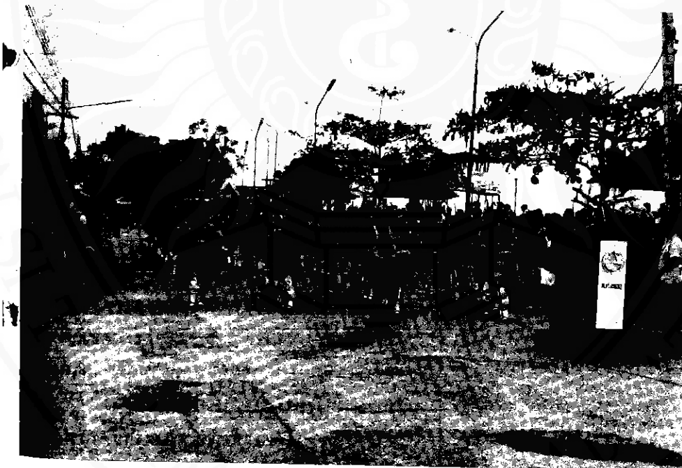
ชาวบ้านใน ในพิธีเปิดงาน ประเพณีลากพระ เมืองปากพ่อง