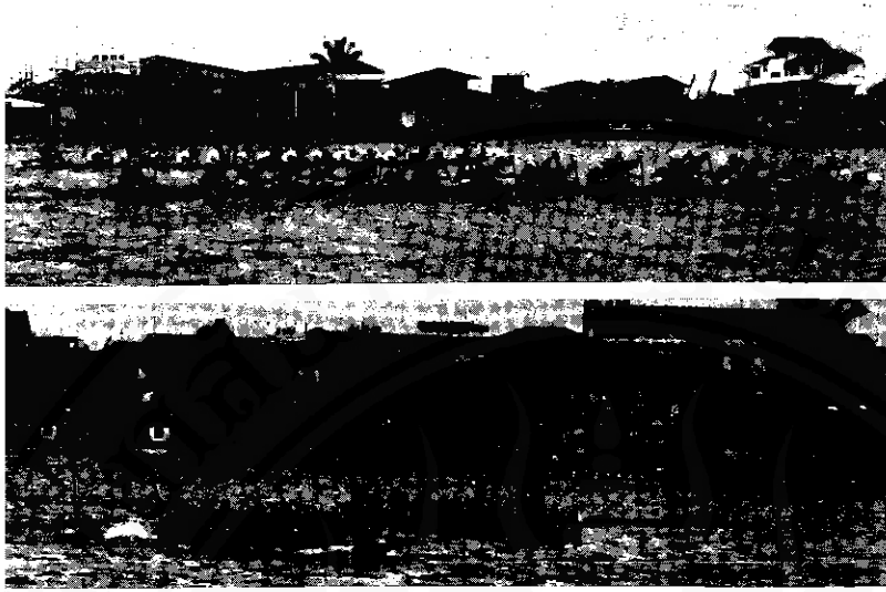
การแข่งขันเรือเพรียวกิจกรรมที่ได้รับความนิยมมากที่สุด