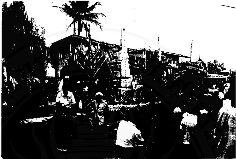
พุทธศาสนิกชนจากวัดวาอารามต่างๆ พร้อมใจกันลากพระมาชุมนุมกันตามวันแฉดและสถานที่ใดหมาย