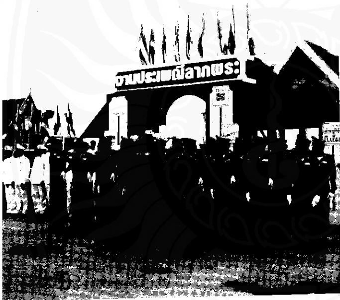
สมาชิกสภาเทศบาลเมืองปากพอง และเจ้าหน้าที่ตำรวจเข้าแถวอรับประธานในพิธีเปิดงานลากพระเมืองปากพอง

บทร้องที่ใช้ในขณะที่ลากพระ ปัจจุบันต่างไปจากเดิมคือจะมีบทร้องสมัยใหม่ตามลักษณะของริ้วขบวนที่จัดขึ้นเป็นส่วนใหญ่ เช่น ใช้บทร้องสำหรับวงกลองยาว บทร้องสำหรับการพ้อนรำชุดต่างๆ เป็นต้น ส่วนบทร้องที่มีสร้อย และตกลงขบวนอย่างทีละคำกันต่อๆ มาก ยังได้ยินได้ฟังอยู่บ้างในขบวนลากพระของชาวบ้านโดยทั่วไป ๑