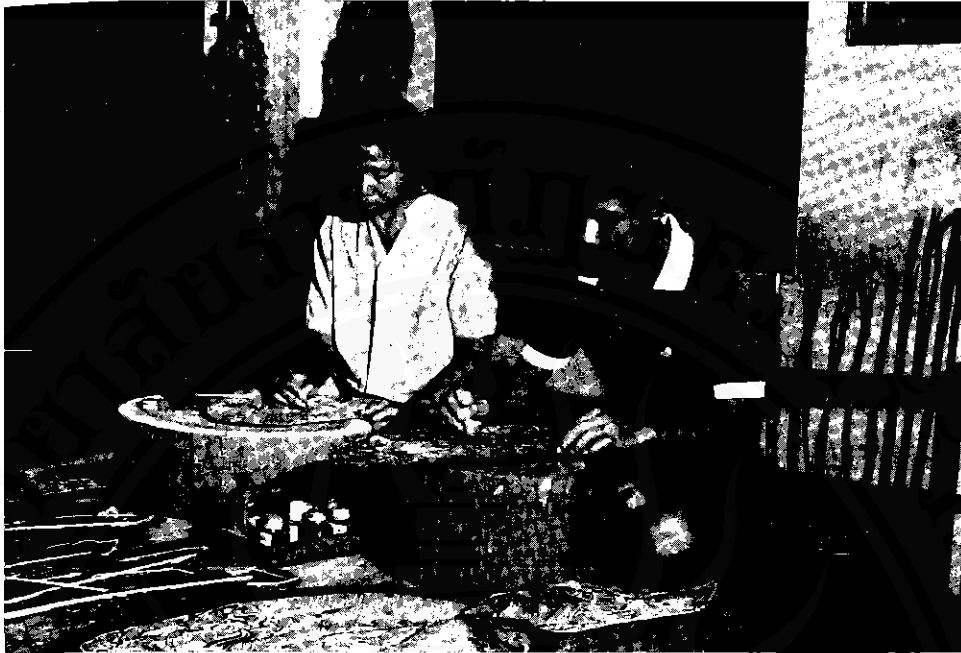
แกะหนังตะลุงเป็นสินค้าที่ระลึก

ทำให้เกิดความปรารถนาทางจิตวิทยา การมีสินค้าวางขายมากมาย และตามข้อเท็จจริงบรรดาพ่อค้าเหล่านี้จะเป็นเพื่อนร่วมธุรกิจมากกว่าจะเป็นคู่แข่งกัน และยังก่อให้เกิดเป็นสิ่งที่สนใจเพิ่มขึ้นมากกว่าที่จะแยกกันอยู่ ผลิตภัณฑ์ที่เสนอขายอาจเหมือนๆ กัน ในด้านคุณภาพและราคา แต่ด้วยเหตุผลที่ผู้ซื้อสามารถเปรียบเทียบในด้านราคา ขนาด สี และคุณภาพ จะช่วยให้ขายผลิตภัณฑ์ได้จำนวนมากขึ้น