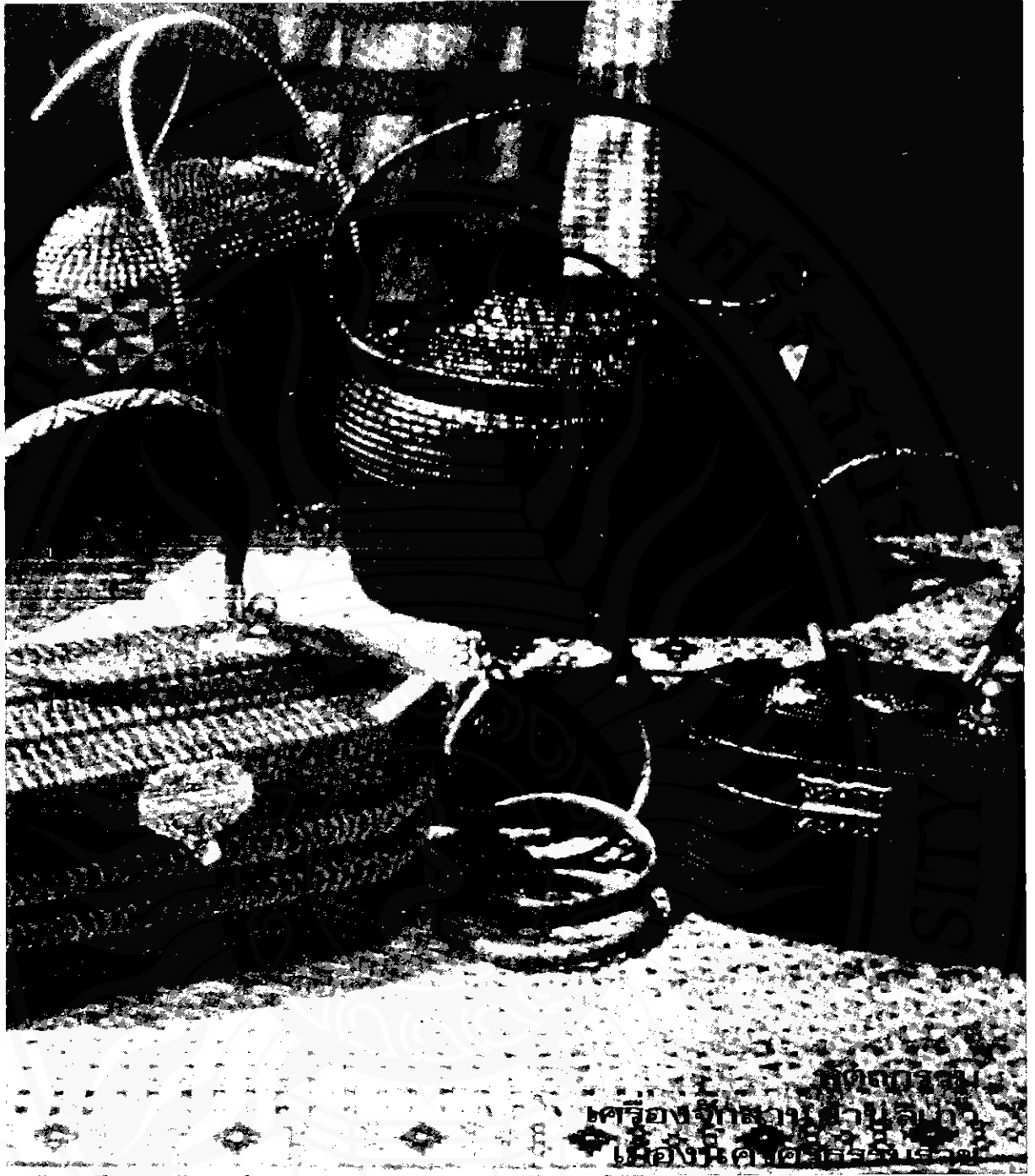
ผลิตภัณฑ์ เครื่องจักสาน บ้านนาเทยว เมืองนครศรีธรรมราช