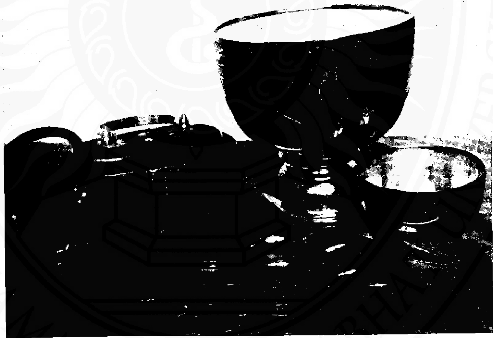
เครื่องถมและกระเป๋าย่างลิเฟา

๖. ผลิตภัณฑ์เครื่องประดับ เป็นสินค้าที่ระลึกที่ได้รับความนิยมจากนักท่องเที่ยวเป็นอันมาก มีร้านค้าขายสินค้าประเภทนี้อยู่บริเวณเดียวกัน ใกล้เคียงสำนักงานการท่องเที่ยว สาขานครศรีธรรมราช แห่งใหม่ และบริเวณวัดพระมหาธาตุวรมหาวิหาร เป็นผลิตภัณฑ์ที่นำเอา ทองคำ เงิน นาก ผสมผสานกับ พวกพลอยต่างๆ เป็นสร้อยคอ สร้อยมือ เข็มกลัด