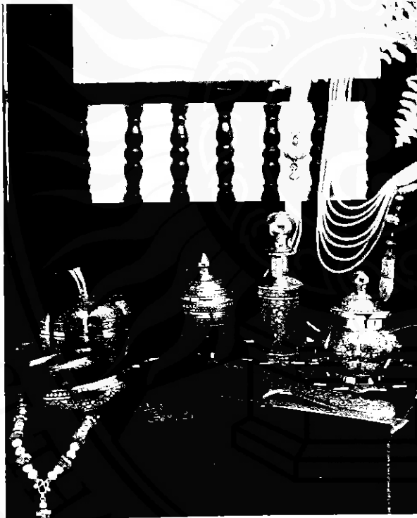
เครื่องถมเมืองนคร

๑. เป็นผลิตภัณฑ์พื้นบ้าน ผลิตภัณฑ์ที่เน้นขายให้แก่นักท่องเที่ยว ซึ่งมีความสำเร็จสูง จะต้องสะท้อนถึงแหล่งท่องเที่ยวที่ตนชื่อผลิตภัณฑ์ โดยเฉพาะรายการของที่ระลึก และของขวัญผลิตภัณฑ์บางอย่าง