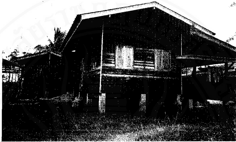
บ้านศิลปิน เพลงบอกเขียน เพชรคงทอง ปัจจุบันตั้งอยู่ที่ บ้าน ลากชาย เลขที่ ๘๑ หมู่ที่ ๕ ตำบลเขาพังไกร อำเภอหัวไทร

ดังสุภายิตสอนสุนทรภู่ ต้องหาคุ้มคุ้มตัวเป็นหัวแหวน แต่แรกอยู่ทะเลปั้งตั้งเดิมแดน แม่มีแฟนเป็นคู่อยู่ลากชาย ๕