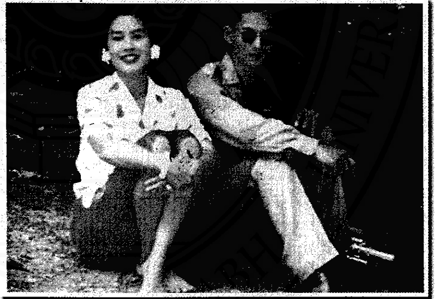
เสด็จน้ำตกพรหมโลก เมื่อวันที่ ๑๕ มีนาคม ๒๕๐๒

นับแต่ได้เสด็จเยี่ยมราษฎรในจังหวัดนครศรีธรรมราชครั้งนั้นมาจนถึงวันนี้เป็นเวลากว่า ๔๗ ปีแล้ว ตลอดเวลาอันยาวนานนี้พระบาทสมเด็จพระเจ้าอยู่หัว ทรงมีพระราชอุตสาหะอันแรงกล้าในการบำเพ็ญพระราชกรณียกิจเพื่อประโยชน์แห่งปวงชน ทั้งโดยทางตรงและทางอ้อม มีพสกนิกรชาวนครได้รับพระราชทานความช่วยเหลือบำบัดทุกข์บำรุงสุขมากมายจนไม่อาจจะคณานับได้ ขอพระองค์จงทรงพระเจริญยิ่งยืนนาน แผ่นรพระบรมโพธิสมภารแห่งพระองค์คุ้มครองเกล้าคุ้มครองระหม่อมพสกนิกรชาวนครทั้งปวงตลอดไปตราบชั่วฟ้าดินสลาย