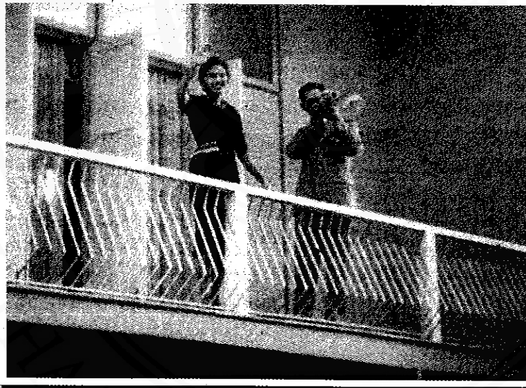
ทรงถ่ายภาพและโบกพระหัตถ์ ขณะประทับที่ระเบียงในจวนผู้ว่าราชการจังหวัดนครศรีธรรมราชเมื่อวันที่ ๑๓ มีนาคม ๒๕๐๒ เวลา ๐๘.๐๐เศษ

วันเสาร์ที่ ๑๔ มีนาคม ๒๕๐๒ เวลา ๐๕.๓๐ น. ได้เสด็จพระราชดำเนินไปยังวัดพระมหาธาตุวรมหาวิหาร ที่บริเวณวัดพระมหาธาตุฯ ได้มีราษฎรชาวนครศรีธรรมราช พากันมาคอยเฝ้าทูลละอองธุลีพระบาท และตั้งโต๊ะบูชา แบบต่างๆ อย่างแน่นขนัด ทั้งสองพระองค์เสด็จพระราชดำเนินเข้าวิหารพระมหาภิเนษกรม (วิหารพระม้า) และเสด็จขึ้นสู่ลานประทักษิณ ทรงพระสุหร่ายสร่งพระบรมธาตุเจดีย์ แล้วพระราชทาน แพร่สีชมพู ซึ่งเป็นเสมือนผ้าพระบฏให้แก่ผู้ว่าราชการจังหวัดนำไปห่มพระบรมธาตุตามประเพณี