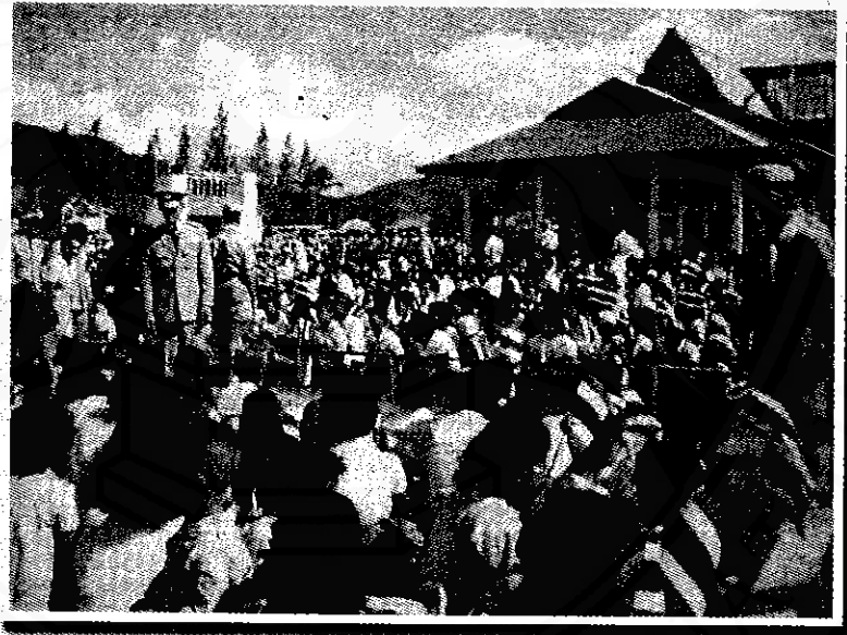
พระบาทสมเด็จพระเจ้าอยู่หัวและสมเด็จพระนางเจ้าฯ พระบรมราชินีนาถ เสด็จพระราชดำเนินเยี่ยม ชาวนครศรีธรรมราช สานามหน้าท่าว่าการอำเภอทุ่งสง เมื่อวันที่ ๑๓ มีนาคม ๒๕๐๒

เนื้อเพลง “ภูมิแผ่นดิน นวมินทร์มหาราช” ข้างต้น แต่งขึ้นเพื่อสดุดีพระเกียรติของพระบาทสมเด็จพระเจ้าอยู่หัวรัชกาลปัจจุบัน ที่ทรงปฏิบัติพระราชภารกิจเพื่อความร่มเย็นเป็นสุขแก่ประชาชนชาวไทยมาแต่ครั้งเสด็จครองราชย์ จนถึงวโรกาสที่ทรงครองสิริราชสมบัติครบ ๖๐ ปี ในปีพุทธศักราช ๒๕๔๕ โครงการที่ทรงปฏิบัติได้แก่โครงการหลวง โครงการส่วนพระองค์ และโครงการตามแนวพระราชดำริ เป็นต้น โครงการเหล่านี้กระจายอยู่แทบทุกจังหวัด รวมทั้งจังหวัดนครศรีธรรมราช