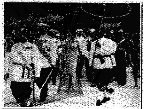
เสด็จพระราชดำเนินไปวัดพระมหาธาตุวรมหาวิหาร วันที่ ๑๕ มีนาคม ๒๕๐๒ เวลา ๐๕.๓๐ น.