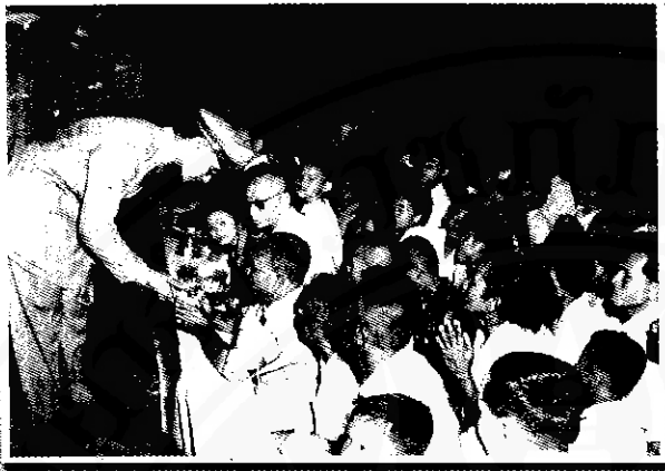
นายกเทศมนตรีเมืองนครศรีธรรมราช ถวายพระพิมพ์ดินดิบจากเจดีย์กษัตริย์ (วัดพระเงิน) เมื่อวันที่ ๑๔ มีนาคม ๒๕๐๒ เวลาประมาณ ๑๗.๓๐ น.