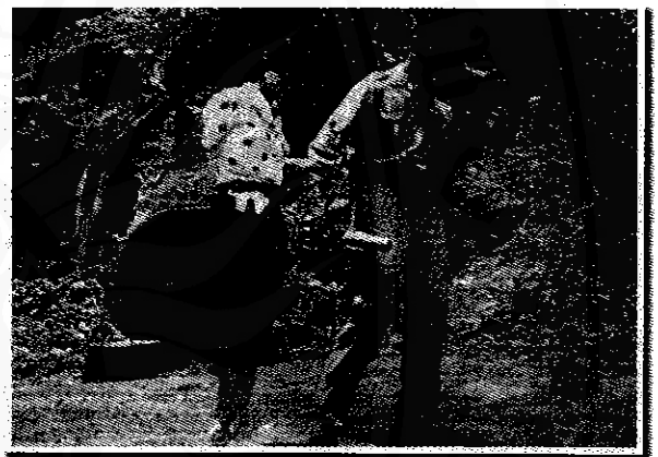
เสด็จพระราชดำเนินไปน้ำตกพรหมโลก ตำบลพรหมโลก (ในเวลานั้นขึ้นกับอำเภอเมือง) เมื่อวันที่ ๑๕ มีนาคม ๒๕๐๒