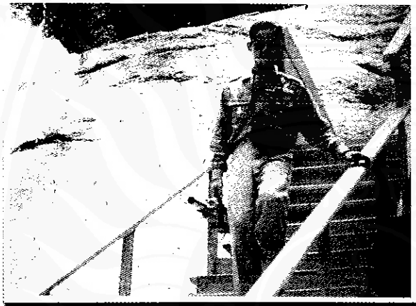
ทรงพักผ่อนอิริยาบถที่น้ำตกพรหมโลก วันที่ ๑๕ มีนาคม ๒๕๐๒