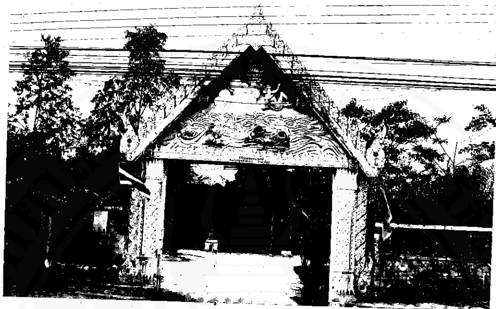
วัดชลเนนิยน

ซ่อมแซมบูรณะพระบรมธาตุเจดีย์และศาสนสถาน ในวัด ตอนเย็นก็พากันกลับโรงเรียนที่พักริมคลอง ทำตังนี่กันเป็นเวลาแรมปี โดยมีพ่อท่านปานเป็น แม่งานและพ่อท่านร่มเป็นผู้ช่วย