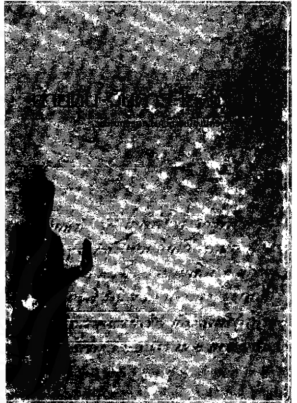
ปกหนังสือนาคัน วันการ โสพนนิมิต

ธรรมจักเสื่อมชูด ชนชนะบุตรมีนช้า ดังจักขุบอดบ้ำ สาสน์เศร้ายศรีหมอง แลนาฯ พรรษาสองพันเศษ สัตว์แสนทเวศชอกช้า ทุกข์ทกถิ่นกินน้ำ เนตรให้มลายเขมม พระเฮฯฯ เปรมแต่เหล่ามฤคยา พงษ์พาลาเหี่ยมเห้า สรรพญูปัทวเบียดพร้าว รุ่มร้ายหลายหลั่น แลนาฯ