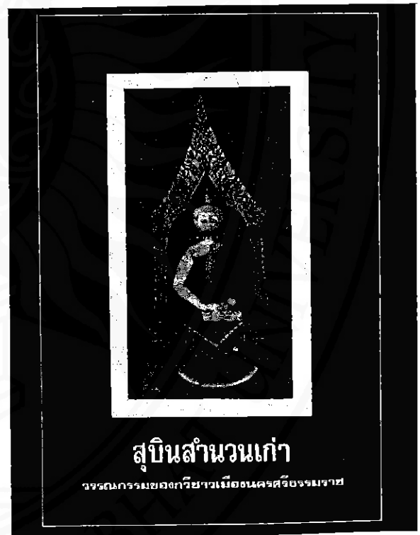
ปกหนังสือสุบินสำนวนเก่า