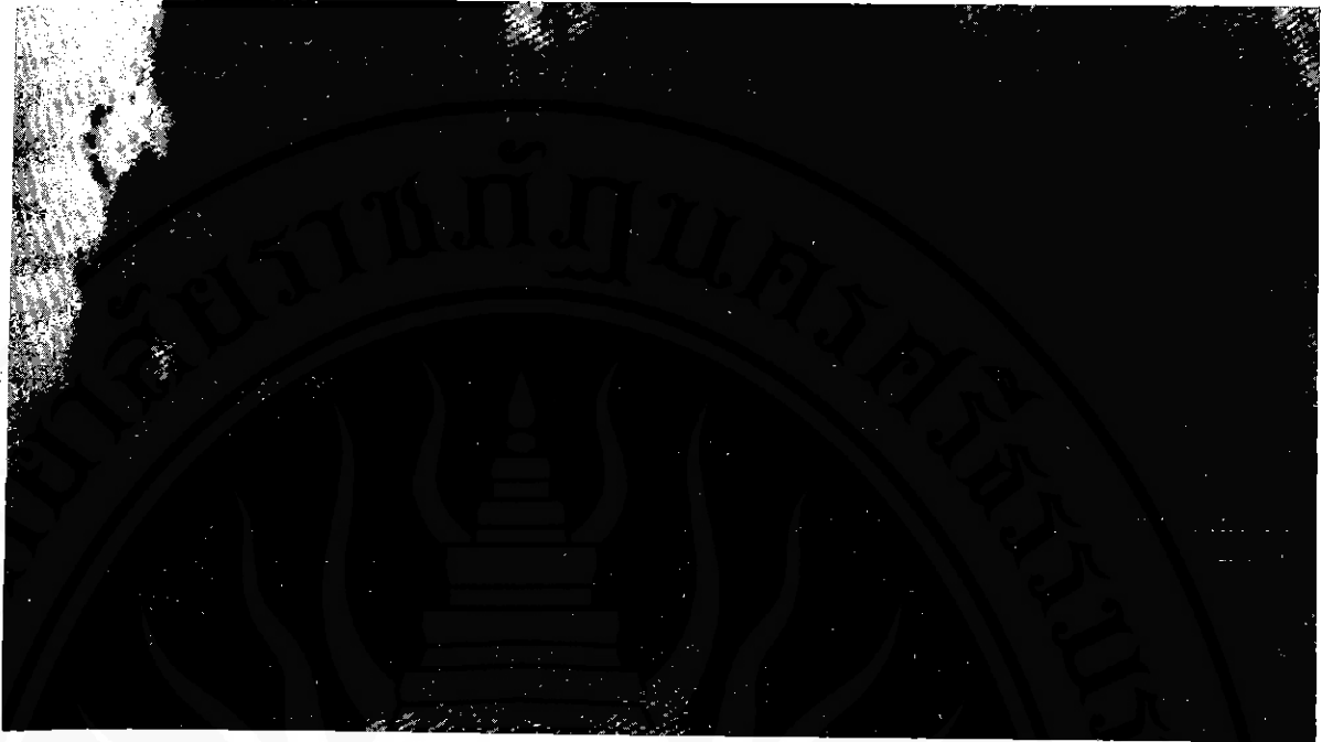
จารึกวัดมหาธาตุ

ความศรัทธาพระพุทธศาสนา ได้แก่ วรรณกรรมประเภทพุทธจรีตหรือพุทธประวัติ ศาสนบุคคล, พระบรมสารีริกธาตุ ซาก/อิงซาก วรรณกรรมกลุ่มนี้มักเน้นไปทางพุทธานุภาพมากกว่าธรรมานุภาพ