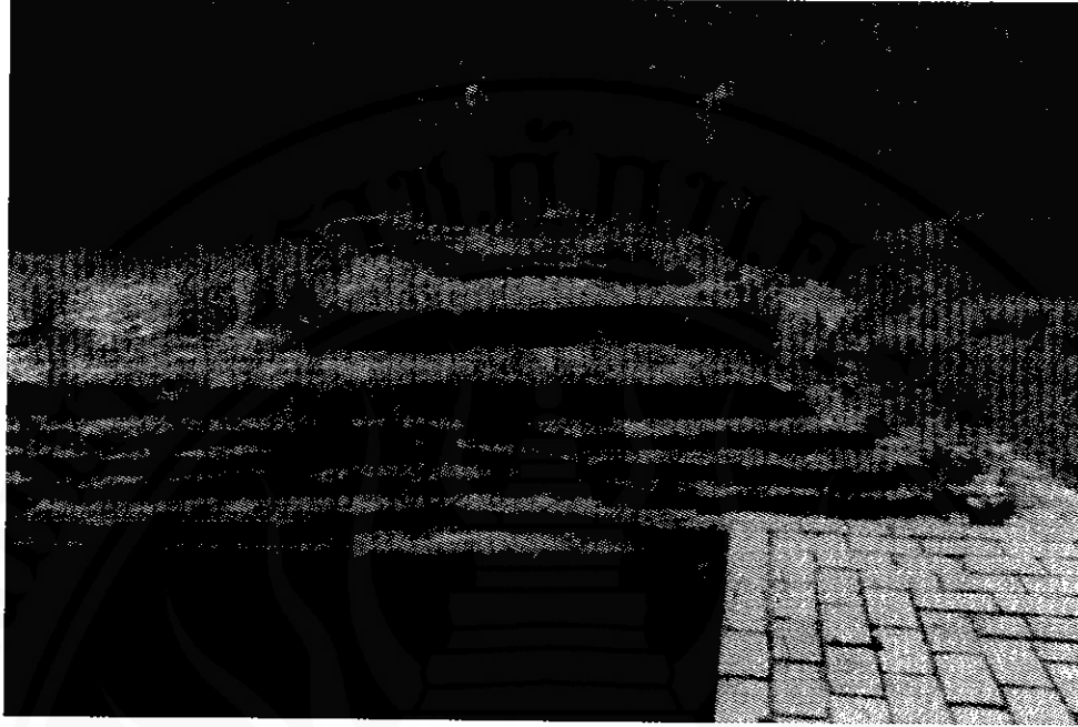
ซากเทวสถาน