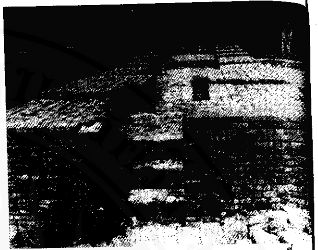
ซากเทวสถานที่ยุบระ

นอกจากนี้ยังพบเสาหินอีกจำนวนหลายเสา ซึ่งมีขนาดพอประมาณได้คือ ขนาดกว้าง ๒๓-๒๖ เซนติเมตร ยาวประมาณ ๗๐-๑๘๐ เซนติเมตร และมีรูลักษณะต่างๆอีกหลายชนิดเอามาประกอบในโบราณสถานแห่งนี้