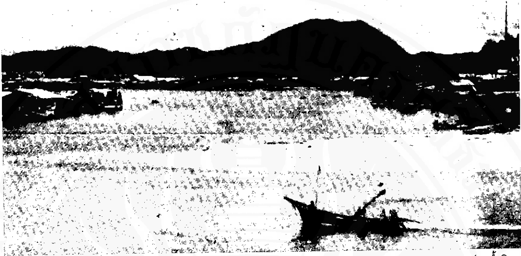
ปากน้ำสิชล

ไวยณพนิกาย นอกจากนี้หลายพื้นที่ยังมีชื่อบ้านนามเมืองที่สะท้อนถึงวัฒนธรรมพราหมณ์อยู่หลายแห่ง เช่น บ้านเทพราช ตำบลเทพราช บ้านสามเทพ เป็นต้น ชื่อเหล่านี้แสดงว่าสิชลเคยเป็นที่ตั้งชุมชนพราหมณ์ซึ่งมีความเจริญมาก่อนชุมชนเมืองนครศรีธรรมราชบนหาดทรายแก้ว