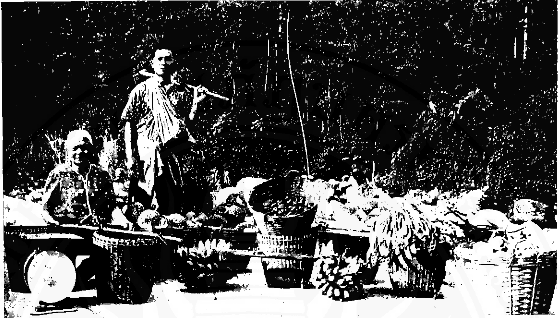
ลานสกาเมืองผลไม้

สัมปทานแปลงใหม่ แล้วนำเรือข้ามถนนสาย นครศรีธรรมราช-ร่อนพิบูลย์ ไปจุดยังแปลงใหม่ที่ อยู่ใกล้กับแปลงเดิมเมื่อ พ.ศ. ๒๕๒๒ จนกระทั่ง เห็นว่าราคาแร่ในตลาดโลกตกลงมา จึงได้ขาย กิจการแก่ “บริษัท สหพิบูลย์ จำกัด”