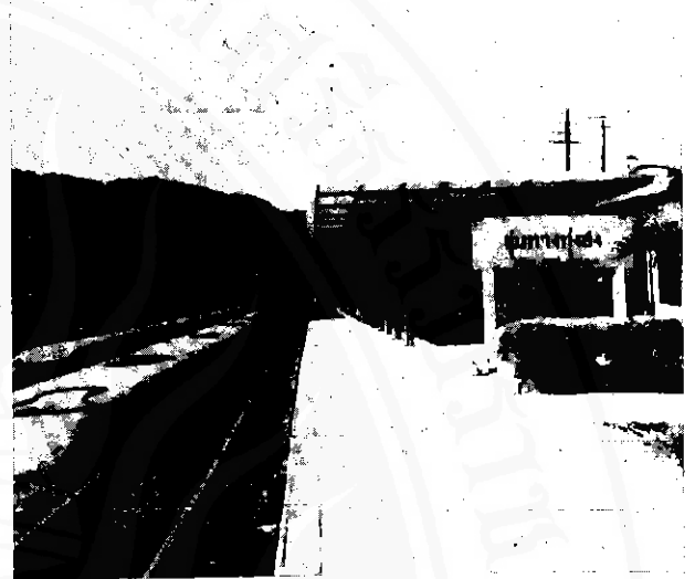
สถานีรถฟุ่มทางทุ่งสง

ครั้น พ.ศ. ๒๕๒๒ ได้แยกท้องที่บางหมู่บ้านของตำบลนาโพธิ์ (คือหมู่ที่ ๑, ๓, ๗, ๘ และ