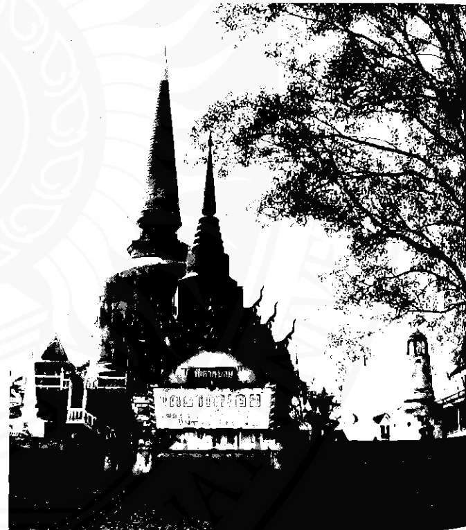
วัดพระธาตุน้อย ปุชนิยสถานสำคัญของฉวาง

ได้พิจารณาเห็นว่าท้องที่อำเภอฉวาง ยังกว้างขวางมาก ยากแก่การกำกับและดูแลทุกข์สุขราษฎร จึงได้เสนอกระทรวงมหาดไทยเพื่อแยกท้องที่ตำบลลำพูนออกไปตั้งเป็นอำเภอใหม่ ชื่อ “อำเภอลำพูน” (ปัจจุบันคืออำเภอบ้านนาเดิม จังหวัดสุราษฎร์ธานี) แม้ว่าจะแยกพื้นที่ไปบ้างแล้ว แต่ด้วยเหตุที่มีพื้นที่กว้าง ท้องที่อำเภอฉวางจึงได้ถูกแบ่งแยกออกเป็นกิ่งอำเภออีกสามกิ่ง คือแยกท้องที่ตำบลพิปูนไปจัดตั้งเป็น “กิ่งอำเภอพิปูน” เมื่อ พ.ศ. ๒๕๑๕ แยกท้องที่ตำบลลำพูนจัดตั้งเป็น “กิ่งอำเภอลำพูน” เมื่อ พ.ศ. ๒๕๓๓ และแยกท้องที่ตำบลข้างกลางไปจัดตั้งเป็น “กิ่งอำเภอข้างกลาง” เมื่อ พ.ศ. ๒๕๓๕ ทำให้ปัจจุบันฉวางประกอบด้วย ๑๐ ตำบล