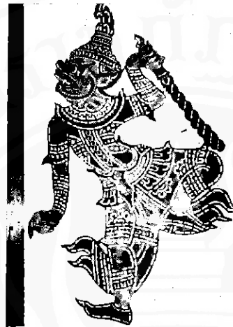
ยักษ์ในนิยายหนังตะลุง