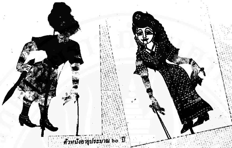
ตัวหนังอายุประมาณ ๖๐ ปี

๓.๓ เป็นรูปตัวหนังตะลุงที่มีขนาดเล็กกว่าตัวหนังตะลุงในช่วงอายุประมาณ ๑๐๐ ปี คือ รูปตัวหนังตะลุงมีขนาดความสูงไม่เกิน ๘-๑๐ นิ้ว และ ๑๑-๑๓ นิ้ว เท่านั้น