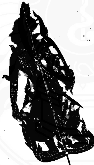
รูปลักษณะการถืออาวฐ "ศร" และ "พระขรรค์"

อุบัติขึ้นก่อนสิ่งอื่นใดจึงมีพระนามว่า พระอาทิตย์ พุทธ บางนิยายเรียกว่า วัชรสัตว์ มีพระวรณะ เป็นสีน้ำเงิน แสดงลักษณะปางสมาธิ รูปเคารพมัก ทำเป็นพระพุทธรูปปฏิมากรทรงเครื่องอย่างพระเจ้า จักรพรรดิ โดยปกติจะเสด็จประทับเหนือดอกบัว แสดงว่ามีพระชาติกำเนิดเป็นทิพย์