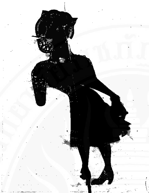
ตัวหนังตะลุงประมาณ ๖๕ ปี

ขนาดคั้งนี้ (ใช้ตัวหนังตะลุงของศิลปินหนังตะลุงจันทร์แก้ว บุญขวัญ เป็นต้นแบบ)