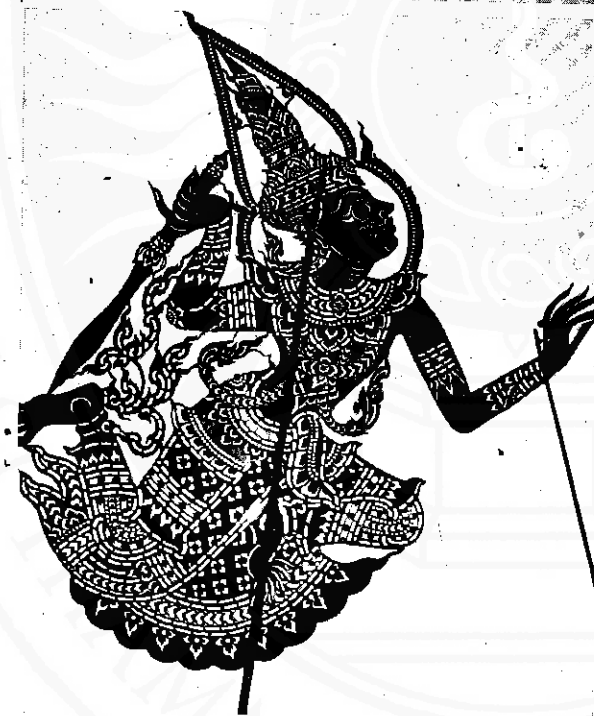
พระอิศวร(บน) พระอินทร์(ล่าง)

และการสนทนากับคนจีนบางตระกูล ตลอดถึงบุคคลที่เกี่ยวข้องประมาณ ๑๐๐ คน ผลการศึกษาพบว่า การเข้ามาสู่ภาคใต้ของคนจีนมีสาเหตุแตกต่างกันในแต่ละยุคสมัย และแต่ละกลุ่มชน การที่ภาคใต้ของประเทศไทยตั้งอยู่ระหว่างแหล่งอารยธรรมจีนและอินเดีย ซึ่งอยู่ในเส้นทางการค้าทางเรือมาตั้งแต่พุทธศตวรรษที่ ๕ ประกอบกับภาคใต้อุดมด้วยสินค้าประเภทเครื่องเทศของป่าและแหล่งแร่ดีบุก ทำให้คนจีนเข้ามาแสวงโชคลาภในภาคใต้เพิ่มขึ้นเป็นลำดับ ครั้นถึงสมัยกรุงรัตนโกสินทร์ การเกิดภาวะการขาดแคลนแรงงานในประเทศและในภาคใต้ก็ดี การเกิดภัยแห้งแล้งและภัยทางการเมืองในประเทศจีนก็ดี ความเจริญทางเทคโนโลยีการต่อเรือและการเดินเรือก็ดี เหล่านี้เป็นปัจจัยให้คนจีนติดต่อโลกภายนอกและอพยพมาสู่ภาคใต้จำนวนเพิ่มขึ้นเรื่อยๆ กลุ่มคนจีนที่อพยพมาเพื่อแสวงหาชีวิตที่ดีกว่ามักอาศัยมากับเรือสำเภาจีนและมักตั้งหลักแหล่งในบริเวณภาคใต้ฝั่งตะวันออกกลุ่มนี้มุ่งประกอบอาชีพโดยสุจริตและพยายามปรับตัวเข้ากับวัฒนธรรมท้องถิ่น ไม่ฝักใฝ่ในเรื่องการเมือง ต่างกับคนจีนที่อพยพผ่านทางมาลายู ปีนัง และ สิงคโปร์ที่ส่วนใหญ่เคยอยู่ในอำนาจของตะวันตก คู่ขนานกับวัฒนธรรมตะวันตก เมื่อย้ายเข้ามาอยู่ในภาคใต้ ส่วนหนึ่งยังสมัครใจจะอยู่ในปกครองของกงสุลชาติตะวันตกที่อยู่ในเมืองไทยเพื่ออภิสิทธิ์ทางการเมืองและทางเศรษฐกิจบางประการ เป็นกลุ่มที่ผูกพันกับคนจีนในเมืองป็นังและสิงคโปร์มากกว่าใกล้ชิดกับคนจีนและวัฒนธรรมไทยในภาคกลาง เป็นกลุ่มที่ผสมผสานกับความเป็นตะวันตกมากกว่าจีนกลุ่มอื่นๆ และยังต่างกับกลุ่มที่อพยพผ่านทางภาคกลางซึ่งส่วนใหญ่จะมีความเป็นตะวันตกมากกว่าจีนกลุ่มอื่นๆ และยังต่างกับกลุ่มที่อพยพผ่านทางภาคกลางซึ่งส่วนใหญ่จะมีความเป็นจีนไม่ต่างกับคนจีนในภาคกลาง ส่วน