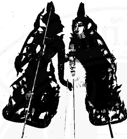
ตัวหนังอายุประมาณ ๒๐๐ ปี