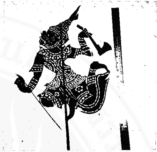
ตัวหนังอายุประมาณ ๑๐๐ ปี

๑.๔ เป็นรูปตัวหนังตะลุงที่มีความประณีตงดงาม คือ เป็นรูปตัวหนังตะลุงที่มีสัดส่วน สมดุล มีกนกกลดลางทั้งงดงาม และมีฝีมือในการตัดแกะ