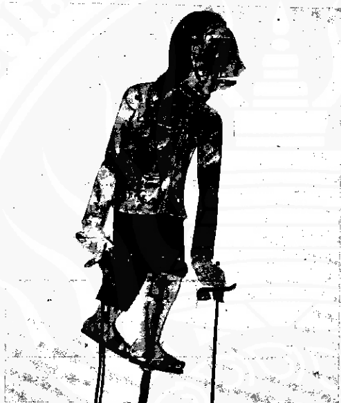
จีนจั่งหรือเจ๊กจั่ง

ปกครอง การค้า และวัฒนธรรม เคยติดต่อกับชาย กับอินเดีย อาหรับ เปอร์เซีย มาช้านาน ทำให้เกิด ปัจจัยต่างๆ อันเนื่องจากผู้คนและวัฒนธรรม วัฒนธรรมฮินดู-ชวาและพุทธ ก่อนที่ศาสนา อิสลามจะแพร่มาสู่บริเวณนี้