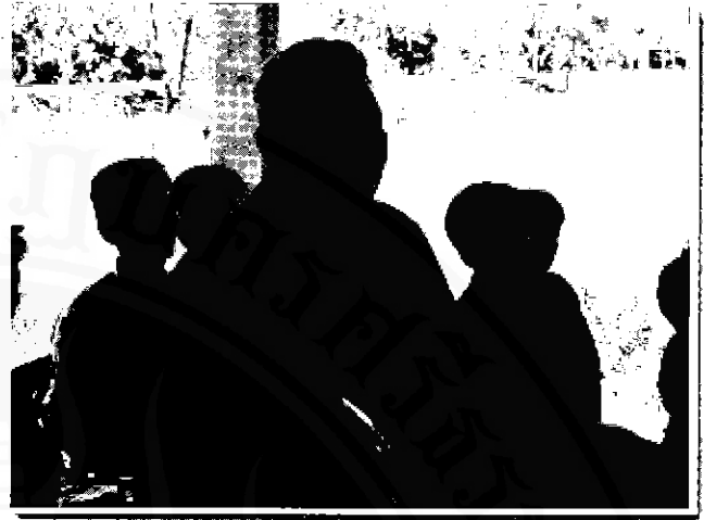
การลุกขึ้นมาพูดถึงปัญหาป่าพรุของชุมชนจะเป็นกระบวนการ สำคัญในการปกป้องรักษาทรัพยากรไว้ให้แก่ลูกหลานในชุมชน