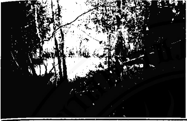
สภาพป่าพรุหลังจากไฟไหม้เมื่อถ่ายภาพในระยะใกล้ๆ