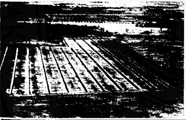
ป่าพรุซึ่งยังสงสัยว่าอยู่ในเขตป่าสงวนหรือไม่ถูกแปรสภาพเป็น ร่องพร้อมที่จะปลูกปาล์ม ตามยุทธศาสตร์พลังงานทดแทน