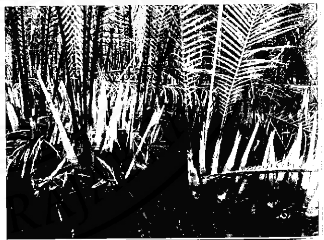
"ต้นจาก" เป็นพืชในระบบนิเวศน้ำกร่อยเมื่ออยู่ในน้ำเค็ม จึงไม่เจริญเติบโต ชุมชนที่ล่มสลายจากนาุ้งหวังกลับมาพึ่งพิง

กล่าวสำหรับลุ่มน้ำปากพองที่มีหลากหลายของ ระบบนิเวศ ๔ น้ำ (เค็ม กร่อย เปรี้ยว จืด) ซึ่งเป็นฐาน ของทรัพยากรที่เป็นปัจจัยการผลิตที่หลากหลายของชุมชน ซึ่งมีความต้องการระบบนิเวศแตกต่างกัน ดังนั้นการจัด การทรัพยากรลุ่มน้ำจำเป็นจะต้องอาศัยความร่วมมือใน ทุกกระบวนการอย่างมีระบบ และหน่วยงาน กลุ่ม องค์กร ชุมชน ทุกระดับ ทั้งนี้การจัดการดังกล่าวนี้ ต้องอาศัย ความรู้ทั้งด้านวิทยาศาสตร์และสังคมศาสตร์พื้นฐานของ ความรู้และความร่วมมือกันอย่างสามัคคี ถ้อยที่ถ้อยอาศัย ในส่วนของชุมชนซึ่งมีวิถีชีวิตใกล้ชิดกับทรัพยากรธรรมชาติ ต้องมีส่วนในการจัดการทรัพยากรธรรมชาติมากที่สุดโดย ได้รับความสนับสนุนจากองค์กรภายนอก และต้องระลึก อยู่เสมอว่าองค์กรจากภายนอกเป็นแต่เพียงผู้ช่วยเหลือ สนับสนุนให้ชุมชนจัดการทรัพยากรธรรมชาติ แต่การ จัดการทรัพยากรธรรมชาติที่ดีที่สุดต้องเกิดขึ้นจากความ ร่วมมือกันของคนในชุมชนเอง