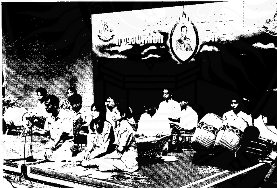
สร้างสี่ตันบรรยาภาค ด้วยนักร้อง-นักดนตรี วง วิทยาลัยนาฏศิลป์นครศรี ธรรมราช