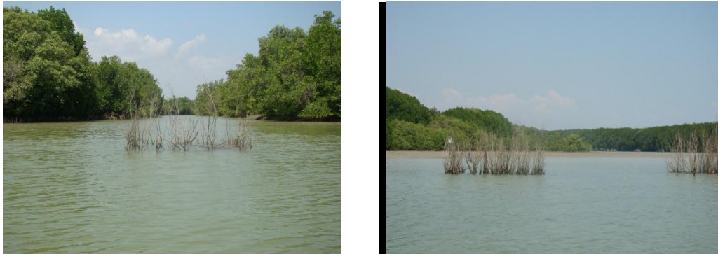
ภาพที่ 2 การนำกิ่งไม้มาปักบริเวณร่องน้ำ

การที่ชาวประมงใช้วิธีนี้ในการจับปลาส่งผลให้เกิดการรักษาทรัพยากรได้เป็นอย่างดี เพราะการนำกิ่งไม้ต่าง ๆ มาสุมไว้เป็นจุด ๆ ในบริเวณคลองท่าแพและคลองสาขานอกจากทำให้เป็นที่อยู่อาศัยของสัตว์ทะเลแล้วยังทำให้เรือประมงพาณิชย์ไม่เข้ามาหาปลาในบริเวณนี้เพราะจะส่งผลต่อเครื่องมือประมง (แต่เรือประมงพาณิชย์ยังใช้เป็นเส้นทางเดินเรือเข้าออกจากท่าจอดเรือไปยังปากอ่าวอยู่)