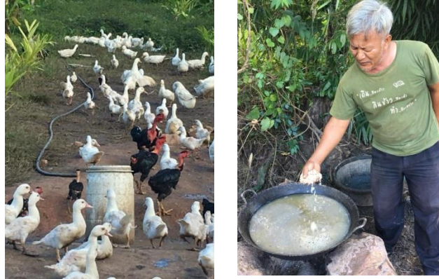
ภาพแสดง กระบวนการเรียนรู้ด้วยตนเอง

จริง มาเป็นข้อมูลที่ได้ มาผ่านกระบวนการคิดวิเคราะห์ ให้เกิดความเข้าใจ เข้าถึงองค์ความรู้ ที่ใช้กระบวนการจัดการระบบให้บุคคลเรียนรู้และฝึกฝนด้วยตนเอง