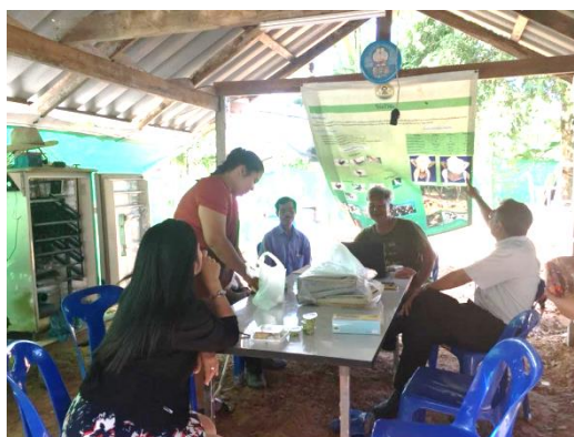
ภาพแสดง ถ่ายทอดความรู้การจัดการบัญชีชุมชน

6. ผู้สอนหรือผู้แนะนำในการถ่ายทอดให้ความรู้ด้านบัญชี เปลี่ยนบทบาทเป็นผู้ให้ความร่วมมือ สนับสนุน การเรียนรู้ด้วยตนเอง จนสมาชิกกลุ่มสามารถเข้าถึงองค์ความรู้ที่ต้องการได้นั้น จะสร้างความรู้สึก ภาคภูมิใจประทับใจจนเกิดการเก็บจำหลักการ และวิธีปฏิบัติทางบัญชี และความรู้สึกภูมิใจไปอย่างยาวนาน อันเป็นแรงกระตุ้นให้เกิดพลังใฝ่รู้ ใฝ่เรียนอย่างต่อเนื่องมาก