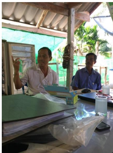
ภาพแสดง กลุ่มอนุรักษ์ไก่ศรีวิชัยร่วมออกแบบการจัดการบัญชี

6. ผู้สอนหรือผู้แนะนำในการถ่ายทอดให้ความรู้ด้านบัญชี เปลี่ยนบทบาทเป็นผู้ให้ความร่วมมือ สนับสนุน การเรียนรู้ด้วยตนเอง จนสมาชิกกลุ่มสามารถเข้าถึงองค์ความรู้ที่ต้องการได้นั้น จะสร้างความรู้สึก ภาคภูมิใจประทับใจจนเกิดการเก็บจำหลักการ และวิธีปฏิบัติทางบัญชี และความรู้สึกภูมิใจไปอย่างยาวนาน อันเป็นแรงกระตุ้นให้เกิดพลังใฝ่รู้ ใฝ่เรียนอย่างต่อเนื่องมาก