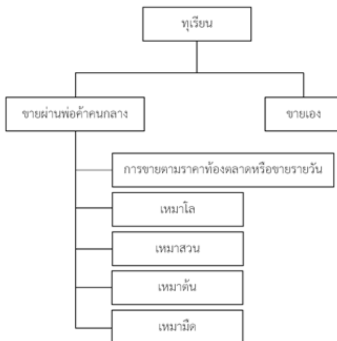
ภาพที่ 1 ช่องทางการจัดจำหน่ายผลผลิตทุเรียนของเกษตรกรตามแนวคิดเกษตรทฤษฎีใหม่

ช่องทางการจัดจำหน่ายของการแปรรูปทุเรียนจะใช้ระบบเครือข่าย เพื่อนฝูง คนรู้จักในการกระจายสินค้า เช่น น้องสาวมารับไปขาย ลูกสาวประกาศขายในเฟสบุ๊ค ประกาศขายในเฟสบุ๊คของตนเอง และประกาศขายทางไลน์ เป็นต้น โดยสามารถอธิบายเป็นภาพดังนี้