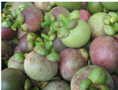
ภาพที่ 2 ลักษณะมังคุดที่เป็นที่ต้องการของพ่อค้าคนกลาง ช่องทางการจัดจำหน่าย ผลผลิตจากการทำสวนมังคุดสามารถอธิบายเป็นภาพดังนี้