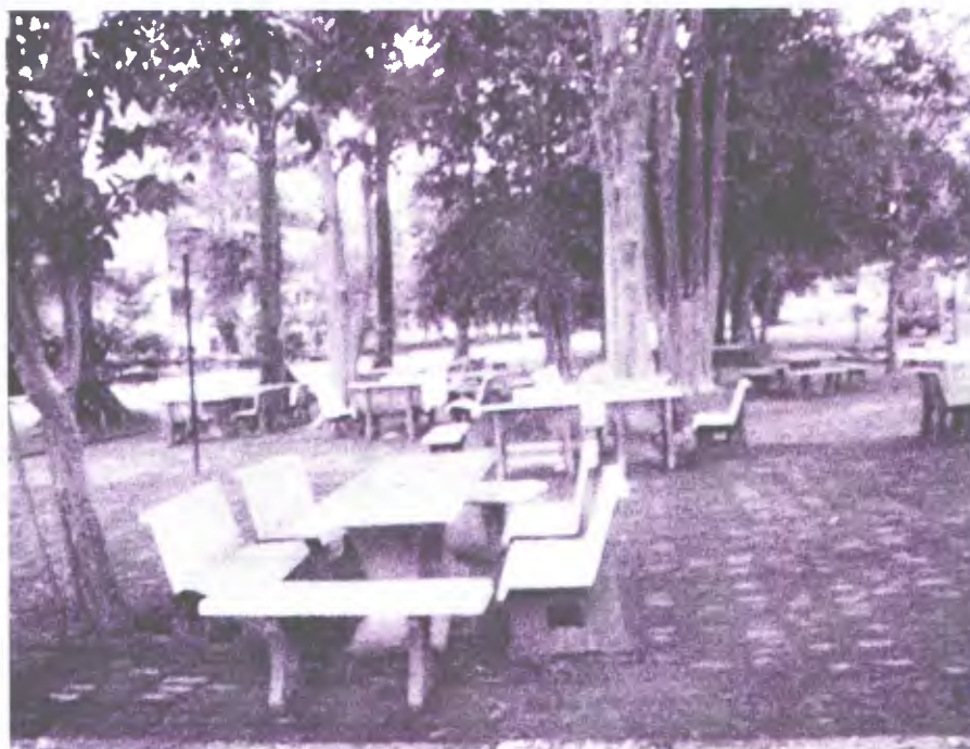
ภาพประกอบ 2 แสดงจุดบริการนั่งพักรอบๆ มหาวิทยาลัย

“.....ไม่สามารถนั่งทำงานกลุ่มหรือทำรายงานได้ตึกคณะได้นานในเวลากลางคืน เพราะมหาวิทยาลัยจะกำหนดช่วงปิดไฟ ซึ่งบางครั้งตามหอพักก็ไม่มีอินเทอร์เน็ต หรือwifi ฟรี ให้ใช้งาน เหมือนในมหาวิทยาลัย ซึ่งบางครั้งก็ต้องสิ้นเปลืองเงินในการซื้อชั่วโมงอินเทอร์เน็ตตามร้านต่างๆ บริเวณหน้ามหาวิทยาลัย.....”