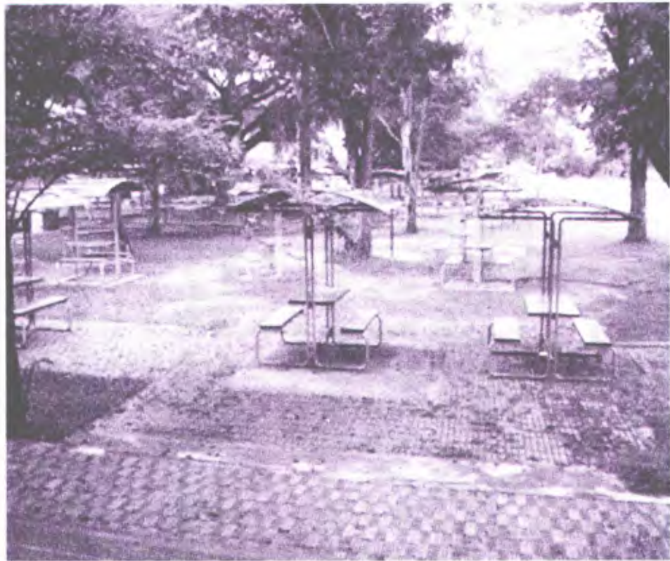
ภาพประกอบ 3 แสดงสถานที่นั่งทำกิจกรรมภายในมหาวิทยาลัยที่มีสภาพทรุดโทรม

2. สภาพปัญหาและอุปสรรคที่ส่งผลต่อการจัดสภาพแวดล้อมที่เอื้อต่อการเรียนรู้ด้วยตนเองของนักศึกษาในมหาวิทยาลัยราชภัฏนครศรีธรรมราช ด้านการจัดการเรียนการสอน