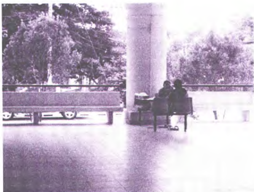
ภาพประกอบ 4 แสดงการรวมกลุ่มของนักศึกษาเมื่อมีการนัดหมายทำกิจกรรมกลุ่ม

“....ในม.จะปิดเปิดไฟเป็นเวลาทำให้ไม่สามารถทำงานในช่วงกลางคืนซึ่งเป็นช่วงที่ทุกคนว่างจากการเรียนแล้ว แต่ม. ก็จะมาปิดไฟบอกว่าหมดเวลาแล้ว...”