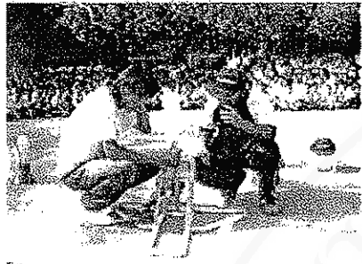
เจ้าหน้าที่จากองค์การพิพิธภัณฑ์วิทยาศาสตร์ กระทรวงวิทยาศาสตร์และเทคโนโลยี สาธิตการแข่งขันจรวดขวดน้ำ ณ โรงเรียนวัดพระมหาธาตุ 27 มิถุนายน 2549