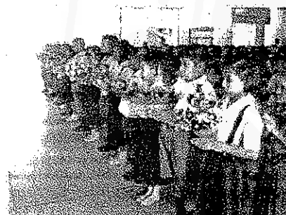
นักเรียนโรงเรียนวัดพระมหาธาตุ ร่วมพิธีไหว้ครูประจำปีการศึกษา 2549 ณ ห้องประชุมโรงเรียนวัดพระมหาธาตุ วันที่ 8 มิถุนายน 2549