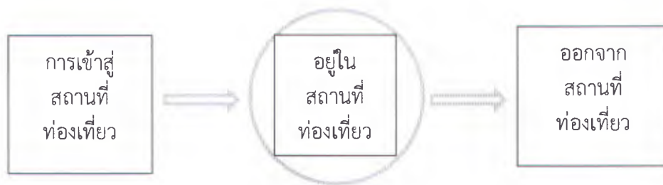
ภาพที่ 2.3 : การแบ่งขั้นตอนของระบบโลจิสติกส์สำหรับการท่องเที่ยวชุมชน

ในแต่ละขั้นตอนของระบบโลจิสติกส์สำหรับการท่องเที่ยวมีการไหลหรือการเคลื่อนที่ (Flow) ที่เกี่ยวข้องของการท่องเที่ยวอยู่ 3 ประเภทคือ การเคลื่อนที่ทางกายภาพ (Physical Flow) การเคลื่อนที่ของข้อมูลข่าวสาร (Information flow) และการเคลื่อนที่ด้านการเงิน (Financial Flow) การเคลื่อนที่ดังกล่าวมุ่งตรงไปยังนักท่องเที่ยวเพื่อให้นักท่องเที่ยวเกิดความพึงพอใจการไหลหรือการเคลื่อนที่ (Flow) ทั้ง 3 ด้าน มีรายละเอียดดังนี้ (คมสัน สุริยะ, 2551)