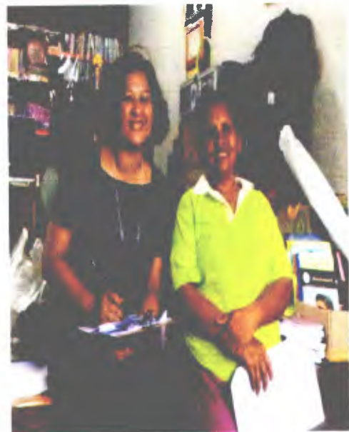
ออกสัมภาษณ์วิสาหกิจชุมชน และนักท่องเที่ยว