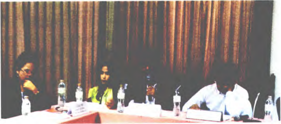
องค์การบริหารส่วนตำบลกำแพงเขา