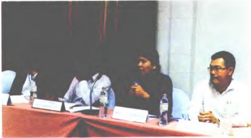
ประธานหอการค้าจังหวัดนครศรีธรรมราช