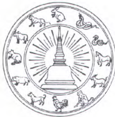
ภาพที่ 2.1 ตราประจำจังหวัดนครศรีธรรมราช

ตราประจำจังหวัดเป็นรูปพระบรมธาตุเจดีย์มีรูปสัตว์ ตามปีนักษัตรล้อมรอบ หมายถึง เมือง 12 นักษัตร จากตำนานเมืองนครศรีธรรมราช ในช่วงพุทธศตวรรษที่ 17-18 มีทั้งหมด 12 เมือง ได้แก่ 1.เมืองสายบุรี ใช้ตราหนู 2.เมืองปัตตานี ใช้ตราวัว 3.เมืองกลันตัน ใช้ตราเสือ 4.เมืองปะหัง ใช้ตรากระต่าย 5.เมืองไทรบุรี ใช้ตรางูใหญ่ 6.เมืองพัทลุง ใช้ตรางูเล็ก 7.เมืองตรัง ใช้ตราม้า 8.เมืองชุมพร ใช้ตราแพะ 9.เมืองบันทายสมอ ใช้ตราลิง 10.เมืองสะอูลา ใช้ตราไก่ 11.เมืองตะกั่วป่า ใช้ตราสุนัข 12.เมืองกระบี่ ใช้ตราหมู ดังภาพที่ 2.1