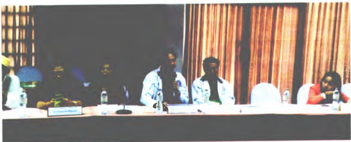
องค์การบริหารส่วนจังหวัดนครศรีธรรมราช ฝ่ายการท่องเที่ยว