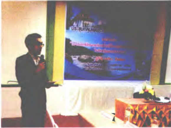
นักวิชาการ