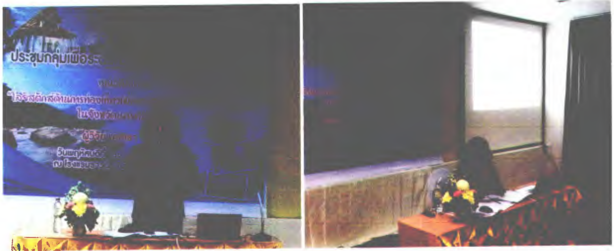
ผู้วิจัยนำเสนอผลจากการศึกษา