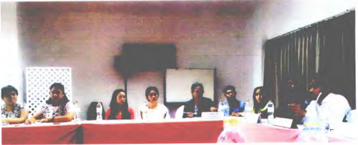
ท้องถิ่นจังหวัดนครศรีธรรมราช