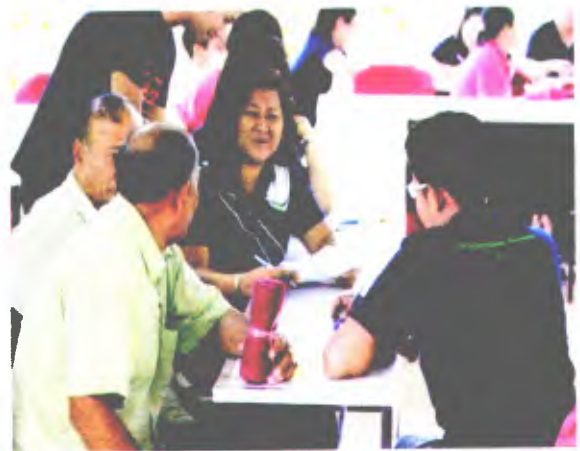
ออกสัมภาษณ์วิสาหกิจชุมชน และนักท่องเที่ยว