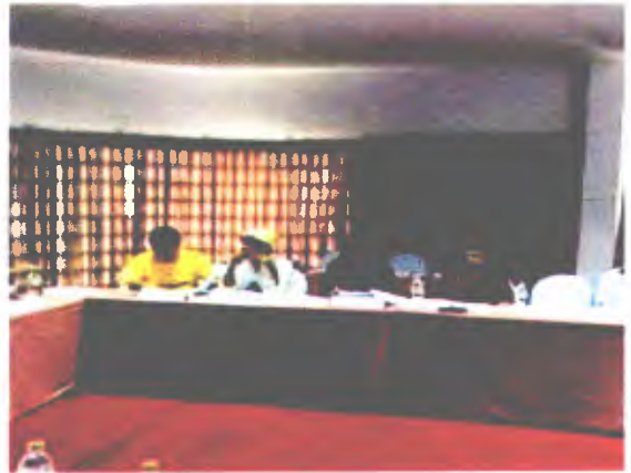
วิสาหกิจชุมชน