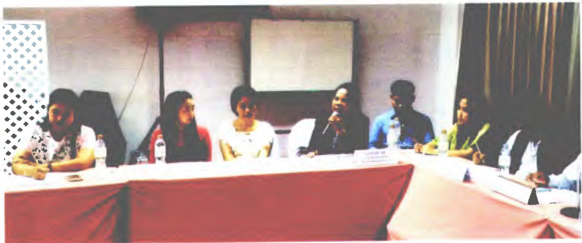
การท่องเที่ยวแห่งประเทศไทย สำนักงานจังหวัดนครศรีธรรมราช