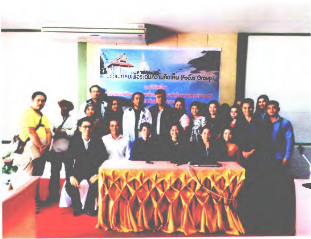
ผู้เข้าร่วมประชุมกลุ่มเพื่อระดมความคิดเห็น