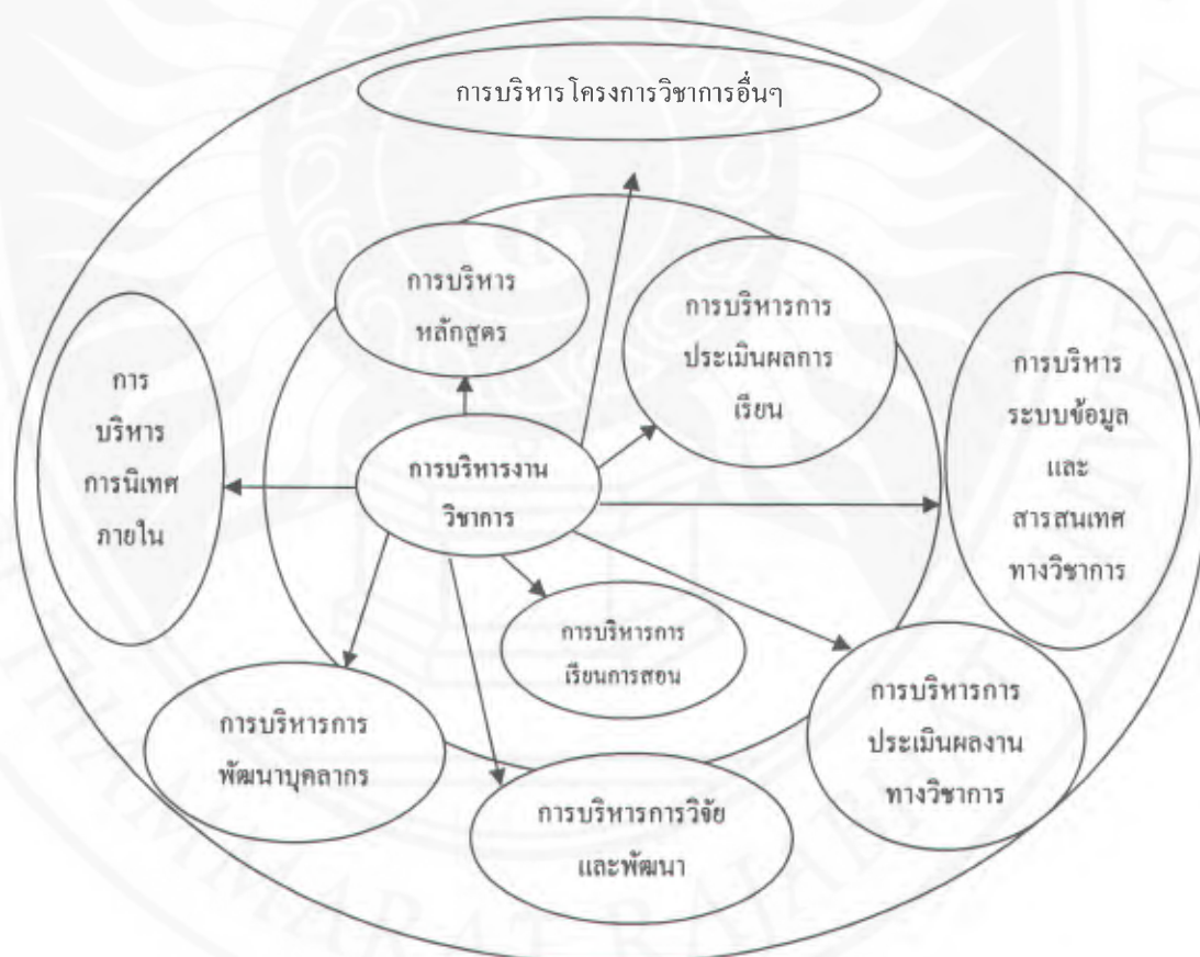
ภาพที่ 2 ขอบข่ายการบริหารงานวิชาการ

จากขอบข่ายของการบริหารงานวิชาการทั้งหมดสามารถสรุปเป็นแผนภาพได้ดังนี้