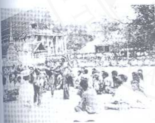
การร่วมในราชูปถัมภ์พระธาตุในอดีต

ตัวอย่างที่เป็นศรัทธาของเหล่าศิลปินพื้นเมืองคือ พวงเพลงบอก หนังตะลุงและโนรา จะกล่าวคำบูชา