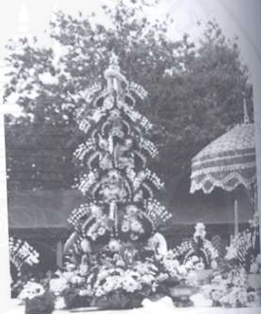
เครื่องบูชาพระธาตุ

กสิกรรม ประเภทเครื่องมือเครื่องใช้ เช่น ถ้วยโถโฆง, ตะบันไฟ, เครื่องประดับ, เครื่องเขียน, ตำรา, คัมภีร์ แสดงถึงความความเชื่อว่าพระมหาธาตุเจดีย์บันดาลให้อยู่ดี กินดี มีสุขภาพอนามัย มีปัญญา ประเภทศิลปะวัตถุและโบราณวัตถุ เช่น ผ้าทอ เครื่องถม งานแกะสลักส่วนใหญ่เป็นผลงานชิ้นเอกของช่างเป็นกวีบุชามีมือ