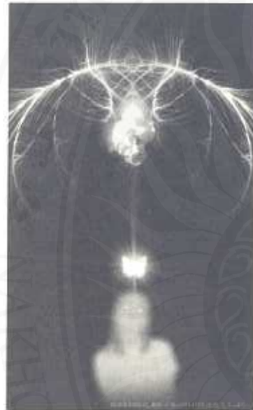
ที่มา: สุพจน์ แสงมณี. 2548