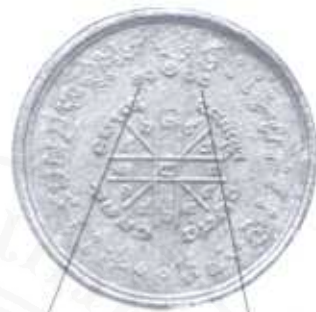
๒๑ แทน หัวใจพ่อ ๑๒ แทน หัวใจแม่ ฉะนั้นการลงอักขระคาถาอาคมไว้จะช่วย

ตัวอย่าง การลงเลขยันต์ด้านหลังของดวง ตราพระเทวราชของมูลนิธิสิริธรฯ จะเห็นเลข ๒๑ และ ๑๒