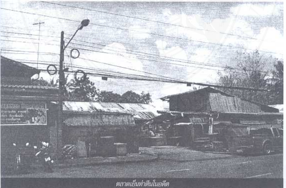
ตลาดเย็นท่าดินในอดีต

พระคลังข้างที่ และขอรับเงินไปจ่ายค่าปลูกสร้างที่ทำลงแล้วกับที่จะ แก้วทำต่อไป เป็นส่วนตลาดตำบลท่าวัง ๕,๐๐๐ บาท และส่วนตลาดตำบลท่าม้า ๖,๐๐๐ บาท รวมด้วยกัน ๑๑,๐๐๐ บาท กรมพระคลังข้างที่ ได้ถวายความเห็นของเจ้าพระยาสมุหนายกไปกราบทูลหรือ สมเด็จพระเจ้าบรมวงศ์เธอ กรมพระยาดำรงราชานุภาพ เสนาบดีกระทรวงมหาดไทย ในเวลานั้นได้รับสั่งว่า พระองค์ท่านได้เสด็จไปตรวจมาแล้ว และได้ทรงแนะนำเองที่จะยกมาเป็นพระคลังข้างที่ กรมพระคลังข้างที่ จึงได้นำขึ้นกราบทูลพระกรุณาในพระบาทสมเด็จพระพุทธเจ้าหลวง ก็ทรงพระกรุณาโปรดเกล้าฯ ให้รับไว้และพระราชทานพระราชกระแสว่า เรื่องนี้กรมหลวงดำรงบอกแล้ว เป็นแต่ไกลอยู่หน่อย ต้องอาศัยเทศาภิบาล ถ้าเป็นพระคลังข้างที่ ไม่พระราชทานใครก็เป็นใช้ได้ ให้รับตลาดทั้งสองนี้ไว้ แลจ่ายเงินไปตามจำนวนนี้เถิด กรมพระคลังข้างที่จึงได้จ่ายเงิน