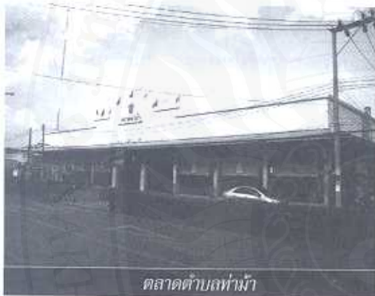
ตลาดตำบลท่าม้า

ตลาดตำบลท่าวัง ปัจจุบันคือตลาดเย็นที่ท่าตีน อยู่ในเขตตำบลท่าวัง คำว่า "ตลาดตำบลท่าวัง" เลิกใช้ไปเมื่อใดไม่มีหลักฐานปรากฏ ส่วน