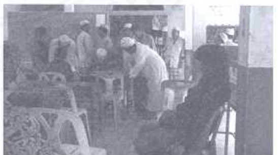
ภาพ การเข้าร่วมประชุมของลัทธิปรัชญาประจำมัสยิดแห่งหนึ่งในสังคมท้องถิ่นโพธิ์ทอง อำเภอท่าศาลา จังหวัดนครศรีธรรมราช

๒) มีการบริหารวิถีพอเพียง การกิจที่เป็นรูปธรรมของจริง การสร้างเกราะภูมิคุ้มกันวิถีชีวิตเป็นเป้าหมายหลักท่ามกลางความเปลี่ยนแปลงในสังคม ปัจจุบันการผลักดันแนวนโยบายเพื่อให้เกิดรูปธรรมสอดคล้องกับองค์ประกอบของบทบาทหน้าที่ จะเป็นคำตอบที่อธิบายว่า "พอประมาณ มีเหตุผล มีภูมิคุ้มกัน" ควบคู่กับการส่งเสริมการเรียนรู้ การยึดถือคุณธรรม จริยธรรม การพัฒนาการเรียนการสอนภาคพัสดุน การเรียนการสอนติดตามอย่างต่อเนื่อง การอบรมกลุ่มมุสลิมะห์ กิจกรรมกลุ่มเยาวชน การอนุรักษ์สิ่งแวดล้อมในท้องถิ่น เป็นต้น ภายใต้การขับเคลื่อนโดยการ ประชุมสร้างความรู้ ความเข้าใจ การจัดกิจกรรมควบคู่กับการรายงานและการประชาสัมพันธ์อย่างทั่วถึง