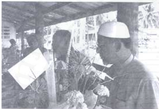
ภาพ อิหม่ามกับกิจกรรมสาธารณะสังคม ซึ่งมีบทบาทสำคัญในสังคมท้องถิ่น ในฐานะผู้นำที่สังคมคาดหวังกับการพัฒนาคุณภาพชีวิตและกระบวนการทางสังคมคุณภาพ

ทั้งการบรรยายธรรม ณ มัสยิดโดยผู้ทรงคุณวุฒิหรือครูผู้เชี่ยวชาญทางศาสนาอิสลาม โครงการทำบุญร่วมกันบริจาคศุภครุภัณฑ์หนึ่งบาททุกวันศุกร์เพื่อสนับสนุนกิจการมัสยิด เป็นต้น